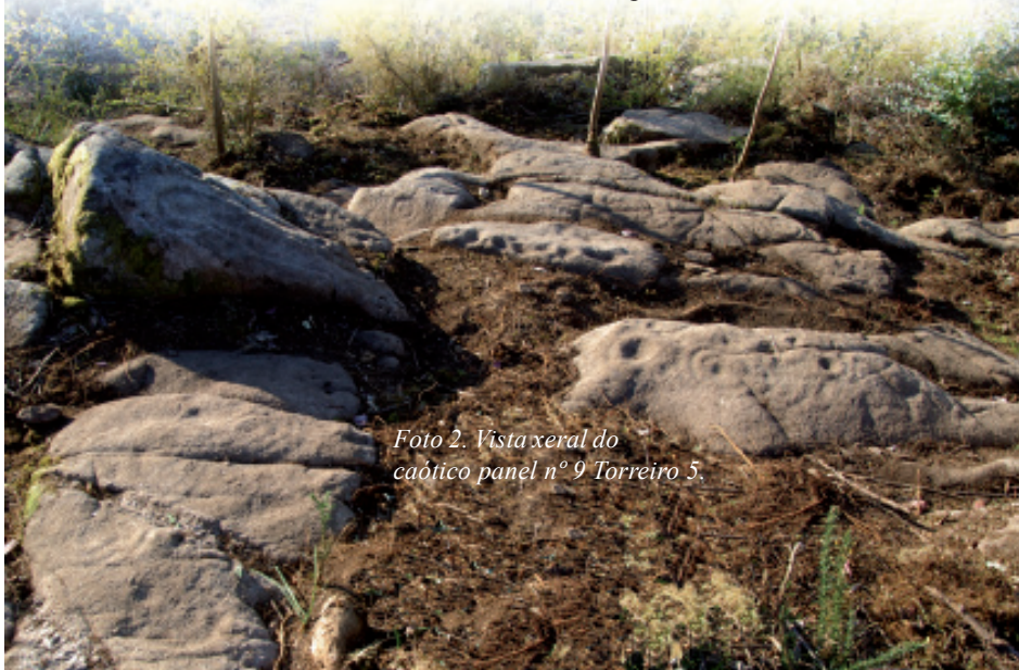
Foto 2. Vista xeral do caótico panel nº 9 Torreiro 5.

Máis ó S temos tres pedras exentas. Na primeira atopamos unha combinación de círculos concéntricos de 4 aros, con un suco de saída cara ó N que acaba en cazoleta. Asociada hai