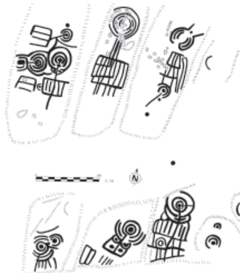
Fig. 3, foto 1. Zona SO do panel Torreiro 3.

4) Torreiro 4 a 8: (coordenadas xeográficas 08°07'39,62"–43°21'11,24" e UTM 570697–4800486, cota de altitude entre 260 a 263 m). É a zona comprendida dende o NL ó SL do panel anterior, e que está conformada por 5 paneis. Partindo de NL a SL atopamos dúas pequenas puntas do afloramento, paneis 4 e 5. No primeiro aparece unha combinación de círculos concéntricos con cazoleta central e suco de saída, e no segundo os restos doutra combinación de círculos concéntricos incompleta e interrompida polas gretas da pedra. Panel 6: Situado máis ó S dos anteriores, e coa mesma cota de altura, ollamos os restos de catro combinacións de círculos concéntricos, dous deles con cazoleta central e un con suco de saída; un circuliño simple; un semicírculo e 3 cazoletas. Panel 7: Ó L do