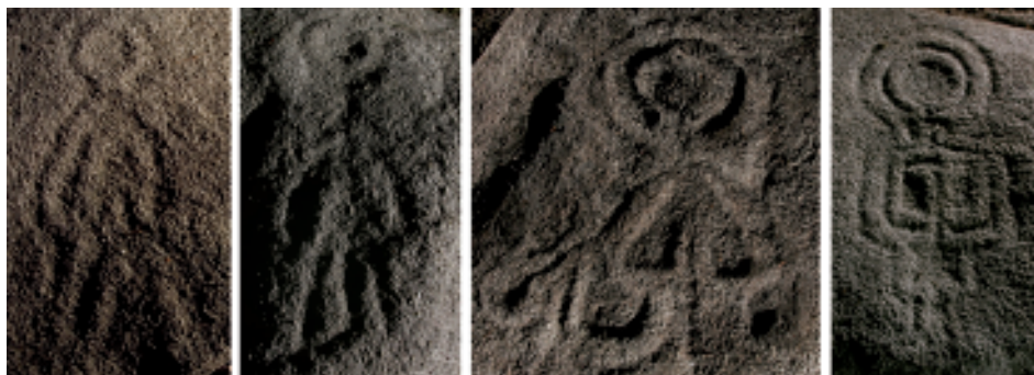
Foto 7. Figuras antropomorfas: 1) Calvela-1, 2-3) Calvela 4, 4) Chousa da Vella 3.

Dentro do traballo feito neste concello só localizamos un gravado que representaba un reticulado (Chousa do Monte 3). Non obstante no panel de Torreiro-3 a práctica totalidade das combinacións de círculos concéntricos gravadas teñen asociados un ou varios reticulados (fig.3 - foto 1), algo que tamén sucede co panel de Súa Lomba 1 (fig. 4 - foto 3). Ignoramos se existe algunha relación entre estes dous últimos paneis, que se encontran separados entre si 350 m, e comparten zona xeográfica, xa que ambos os dous están na parte alta da canle do regato de Monduriz.