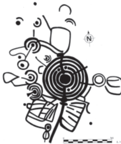
Fig. 4, foto 3. Panel Súa Lomba 1.

8) Súa Lomba-3: (Coordenadas xeográficas 08^{\circ}07'40,40'' - 43^{\circ}21'00,09'' e UTM 570683 - 4800142, cota de altitude 252 m). Son dous tramos de pedra a ras do chan, separados entre si por unha gran diáclase. En conxunto miden 4 N-S x 9 m de L-O. Na pedra situada ó SL visualizamos 3 combinacións de círculos concéntricos de dous e tres aros todas elas con cazoleta central, e dúas delas con suco de saída; 3 semicírculos de un e dous aros, con cazoleta central e un deles con suco de saída; e dúas figuras de forma cuadrangular.