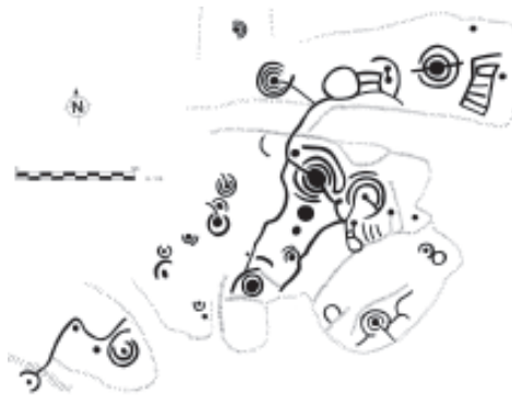
Fig. 5, foto 6. Zona S do panel Chousa de Anido 2.

28) Chousa da Peneda-1: (Coordenadas xeográficas 08°06'50,07" – 43°19'44,15" e UTM 571841 – 4797811, cota de altitude 200 m). Son dúas pequenas pedras situadas na punta L do afloramento, que teñen unhas dimensións en conxunto de 2,80 N-S x 3,80 m L-O. Na parte inferior dunha delas localizamos un círculo moi esvaecido con dous sucos laterais de saída, e na parte superior dúas cazoletas; na outra pedra atopamos unha cazoleta e un pequeno circuliño con cazoleta central.