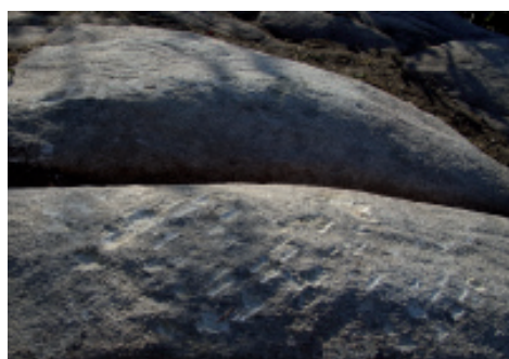
Foto 8. Destrozos recentes no panel Torreiro 3.

Na actualidade, debido á praga que sofren os eucaliptos, estase a talar e deforestar na zona unha cantidade importante dos montes. Esta deforestación e a posterior limpeza con maquinaria, destruíu total ou parcialmente varias combinacións de círculos do panel de Torreiro 3 (foto 8), e afectou de maneira dispar ós grupos de Súa Lomba e Chousa de Tras, entre outros. Nada imputable ós propietarios, xa que todos estes paneis eran descoñecidos e polo tanto preséntanse inéditos neste traballo. Nós, como Asociación, intentamos protexer dentro das nosas posibilidades o noso patrimonio, pero dende aquí queremos chamar a atención e solicitar ás administracións locais e autonómicas un plan integral para a zona que conteña as medidas oportunas para evitar a destrución deste fráxil patrimonio*.