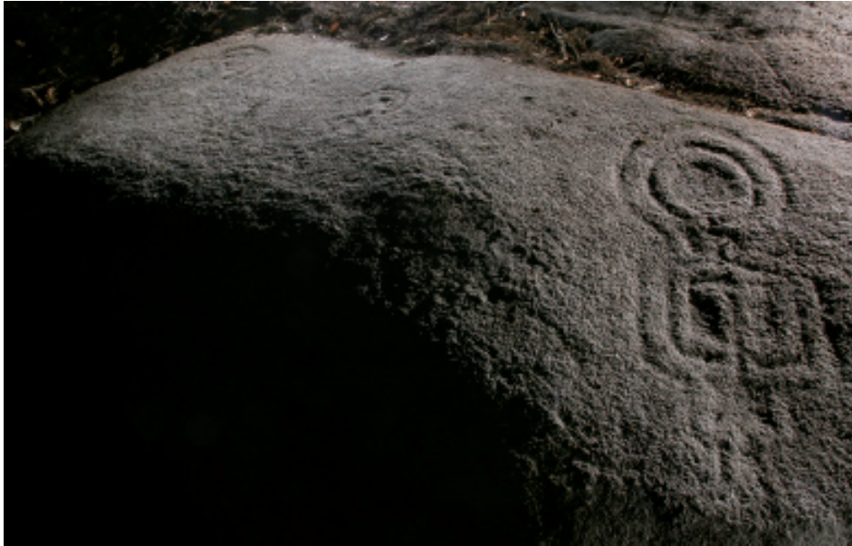
Foto 4. Figura antropomorfa na zona NO do panel Chousa da Vella 3.

composta por unha serie de trazos cuadrangulares alternados por espazos simétricos que foron baleirados. Todos estes gravados están perfilados por un só trazo que fai un efecto de remarcado. Nesta zona norte tamén ollamos dúas combinacións de círculos concéntricos de 4 aros con cazoleta central e suco de saída; un semicírculo con cazoleta central e suco de saída; 3 pequenas figuras de círculos concéntricos de dous aros con cazoleta central das que penden outro círculo e dúas figuras ovaladas respectivamente.