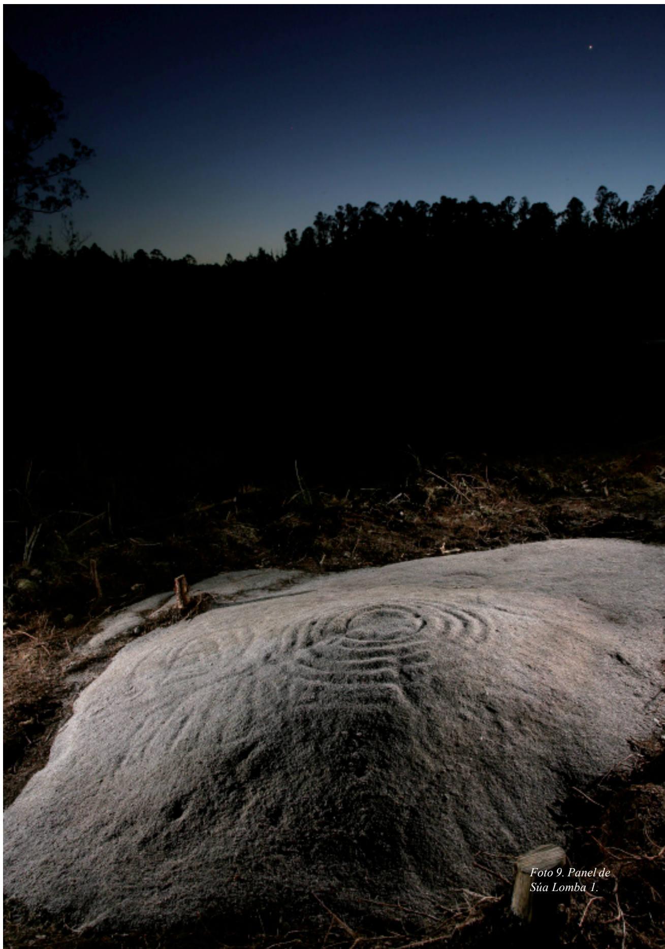
Foto 9. Panel de Súa Lomba 1.