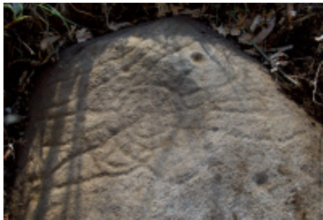
Foto 5. Panel da Chousa da Vella 5.

A) Chousa do Montañes-1: (Coordenadas xeográficas 08°07'46,29"–43°20'20,53" e UTM 570563 – 4798926, cota de altitude 212 m). Trátase da ampliación dun panel publicado en 2008 7 composto por «... un círculo de 22 cm de diámetro con cazoleta central e un suco de saída que remata nunha figura xeométrica de difícil interpretación» que se atopaba ó S dun valo de pedras. A parte que ampliamos está ó outro lado do valo, cara ó N, nel atopamos un combinación de