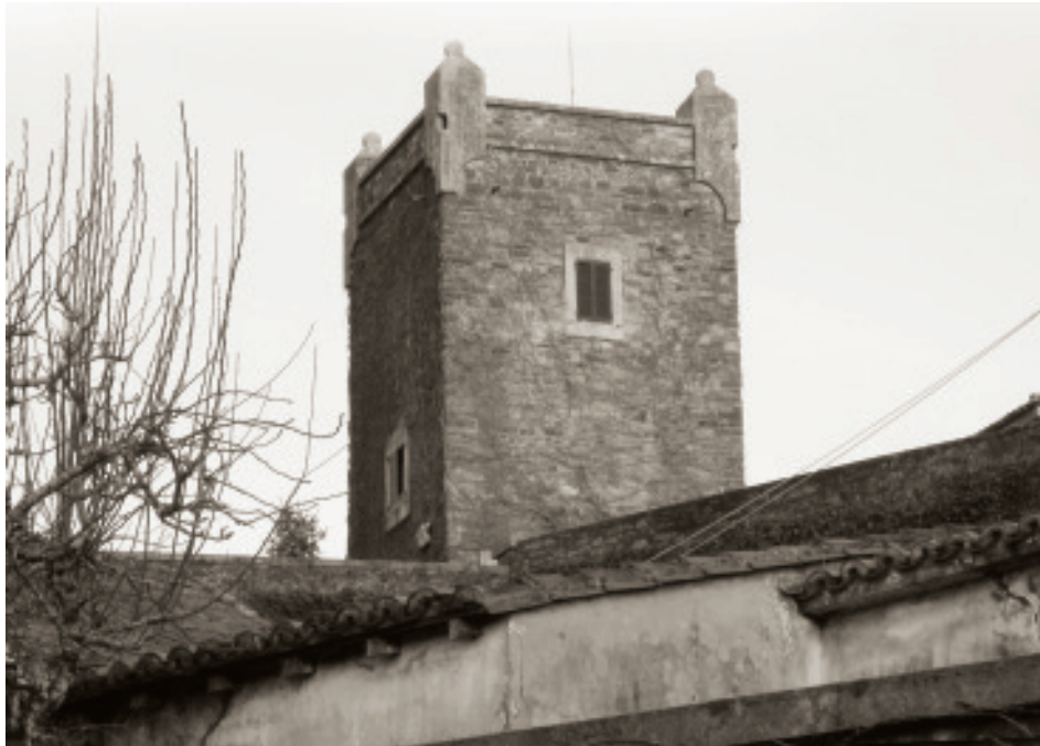
Arriba, torre medieval de Fiobre.

Abajo, vista parcial del pazo de Mariñán. Ambos monumentos en el ayuntamiento de Bergondo.