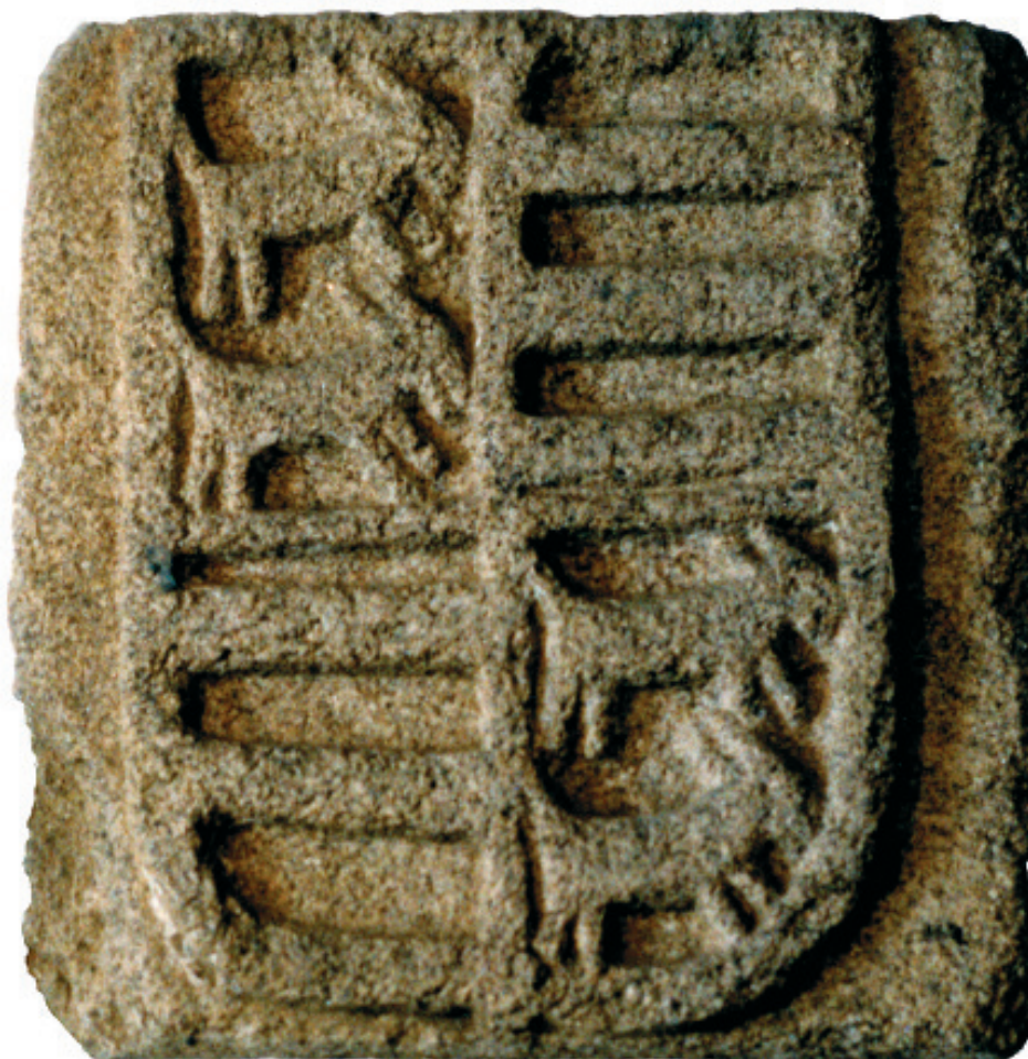
Escudo de los Villouças, procedente de una casa de Betanzos de la Rúa da Cerca. Museo das Mariñas.