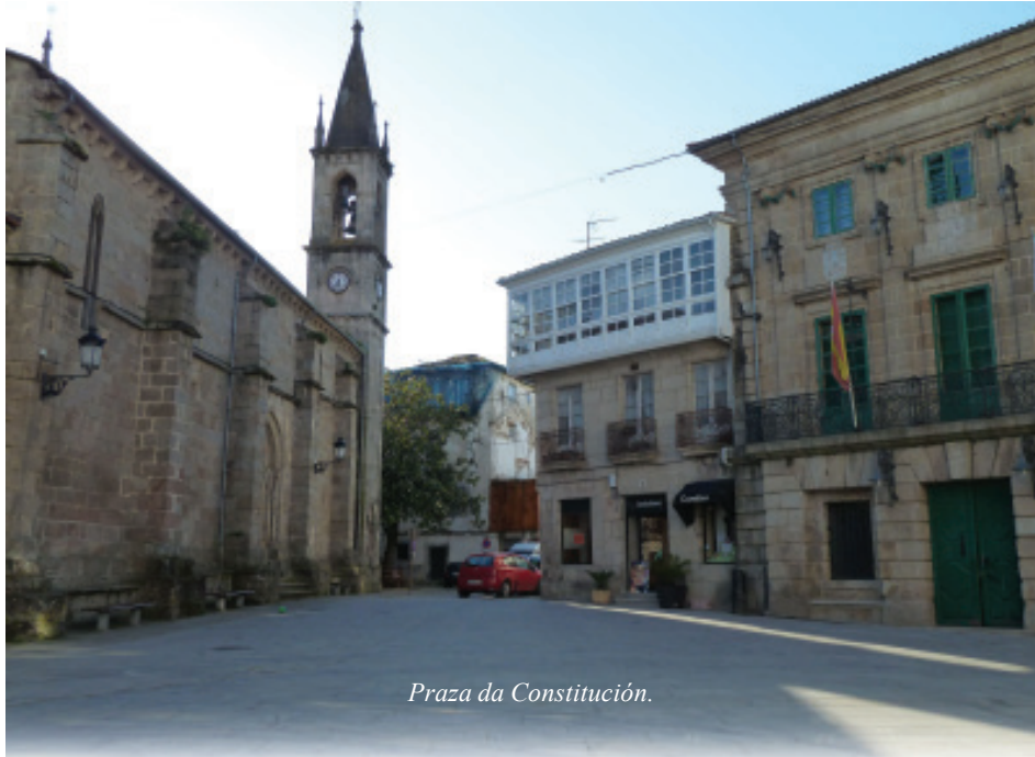
Praza da Constitución.

cultores, mariñeiros, comerciantes, artesáns, burgueses, nobres, xudeos... xente de igrexa, mecenas... contribuíron, na súa medida, á formación da cidade e, aínda hoxe, recoñécense nela o que cadaquén aportou.