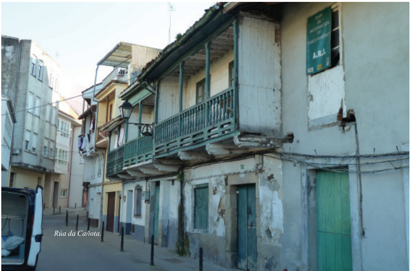
Rúa da Cañota.