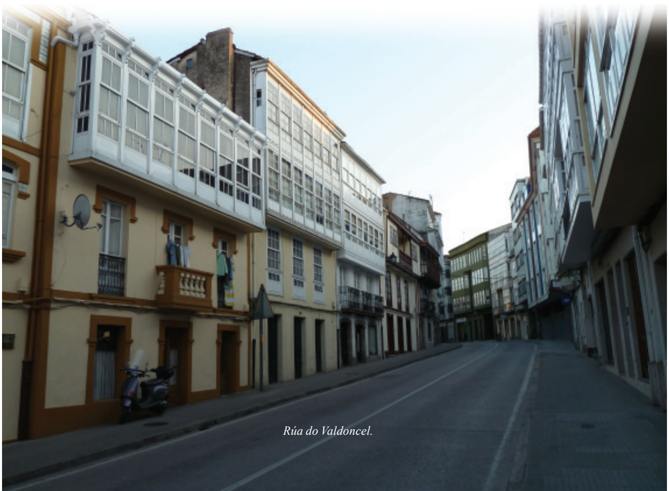
Rúa do Valdoncel.

Os nobres, dende a Alta Idade Media déronlle, coa construción das súas casas e pazos urbanos, calidade o tecido edificado. Recoñécese as súas obras polos materiais, a tecnoloxía empregada e polo tamaño do solar ocupado. O acabado en pedra labrada dos ocos, remates, esquinas... serviron de modelo para outras edificacións que copiaban materiais e técnica.