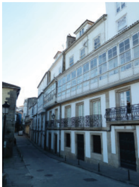
Rúa da Fonte de Unta.

Con este breve repaso pola realidade que atopamos, quérese sinalar que a cidade que coñecemos/herdamos é froito da sociedade, da súa capacidade tecnolóxica e das súas aspiracións, en todos e cada un dos momentos históricos.