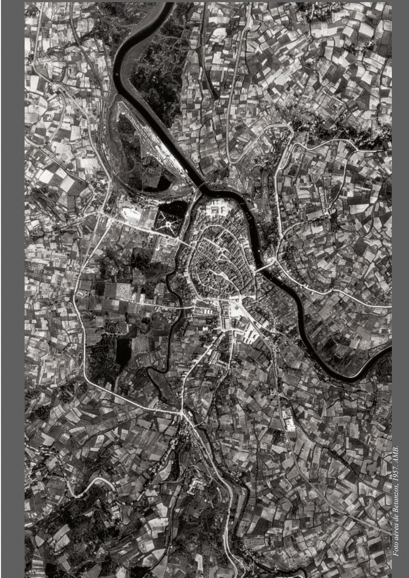
Foto aérea de Betanzos, 1957.