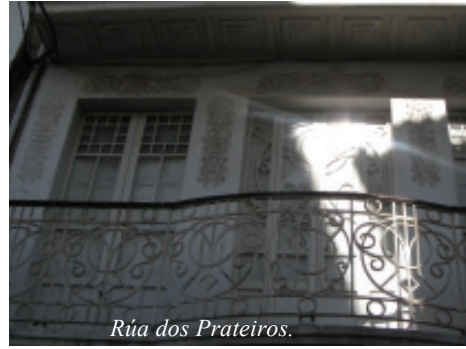
Rúa dos Prateiros.

locais, como para facer deste lugar un punto de referencia comercial e de mercado. A 1ª feira foi concedida por Sancho IV (século XIII), logo unha feira «franca» no século XV (permitía a venda libre e troco durante un mes, protección ós feirantes...). A arquitectura asociada é a «casa gótica mercantil». Recoñécese por dispor de baixos comerciais con «trastenda», peza que se relacionaba cun patio traseiro alleo ó público (con paso polo interior das illas/mazás, hoxe desaparecidos) e na planta alta a vivenda do comerciante. Esta arquitectura define a imaxe dalgunhas rúas do casco e dos seus arredores. Os espazos para as feiras e mercados mestúranse e a voltas organizan o tecido urbano.