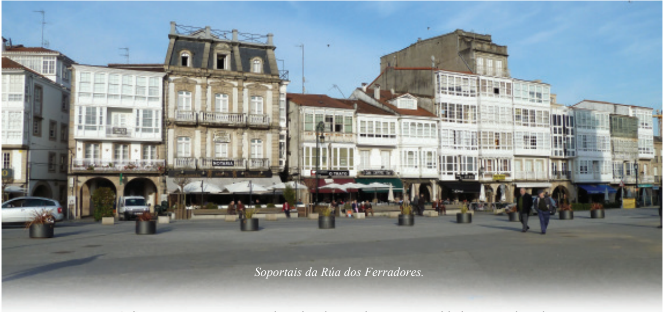
Soportais da Rúa dos Ferradores.

A igrexa, sempre presente de xeito destacado nas comunidades agrícolas, destaca aquí, pois tres dos templos máis significativos do románico tardío galego atópanse nesta cidade: o convento de San Francisco (do que só queda o templo), e as igrexas de Sta María e de Santiago. Construídas no derradeiro tercio do século XIV, e probablemente polos mesmos gremios e albaneis (repetición de motivos relixiosos, o mesmo xeito de facer os relevos, similar estilo arquitectónico...) constitúen un conxunto monumental único, que destaca sobre o tecido residencial. Sta María e Santiago, por ser parroquias, organizaron