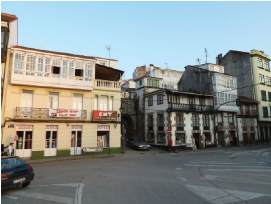
Arriba, Porta da Ponte Nova. Abaixo, Rúa dos Prateiros.

de defensa do imaxinario cultural, que procure o equilibrio entre as esixencias do progreso e a salvagarda dos valores ambientais. Que conteña: