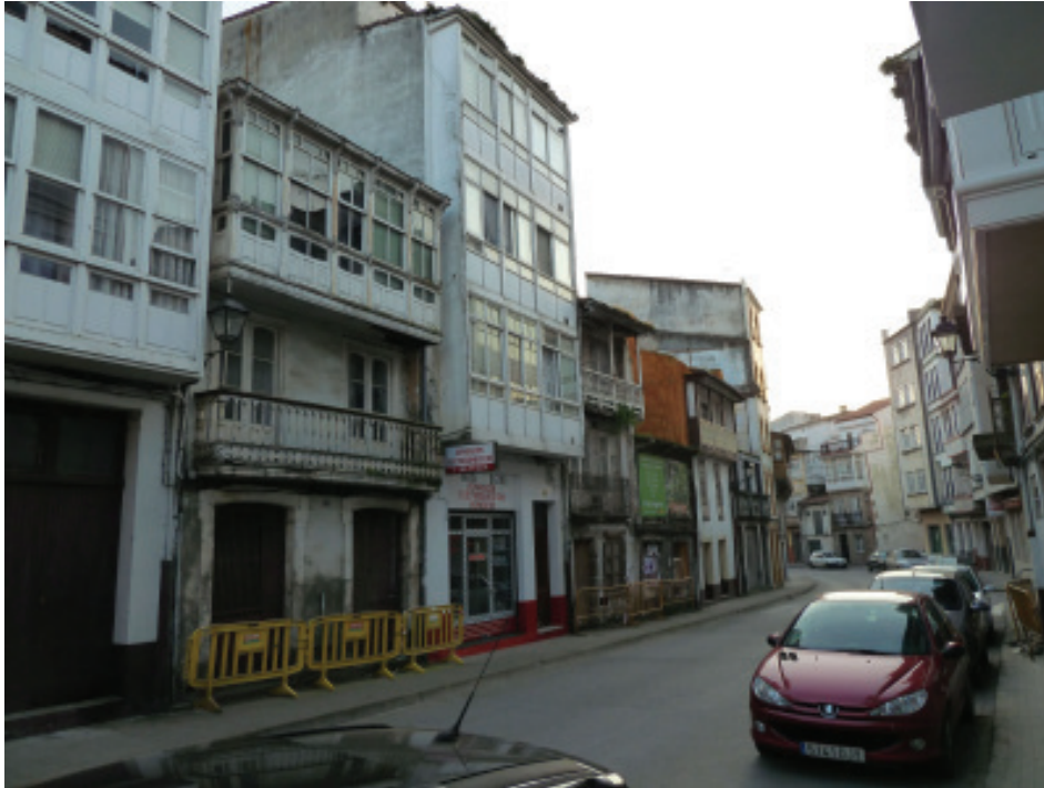
Rúa da Ribeira.