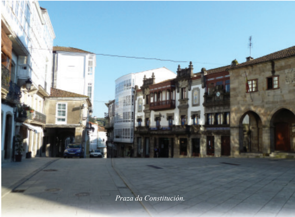
Praza da Constitución.