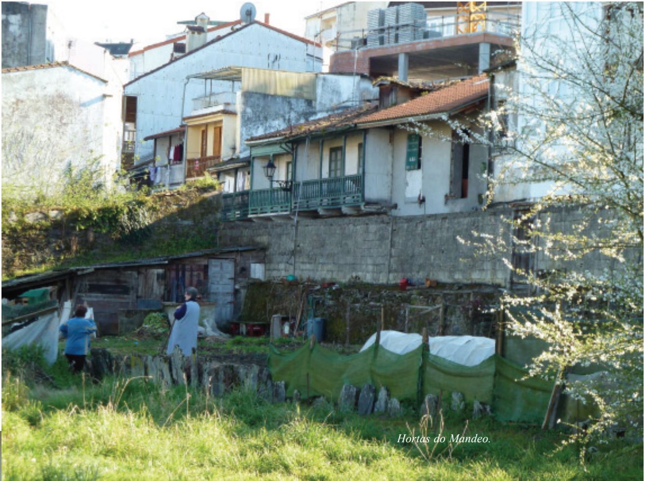
Hortas do Mandeo.