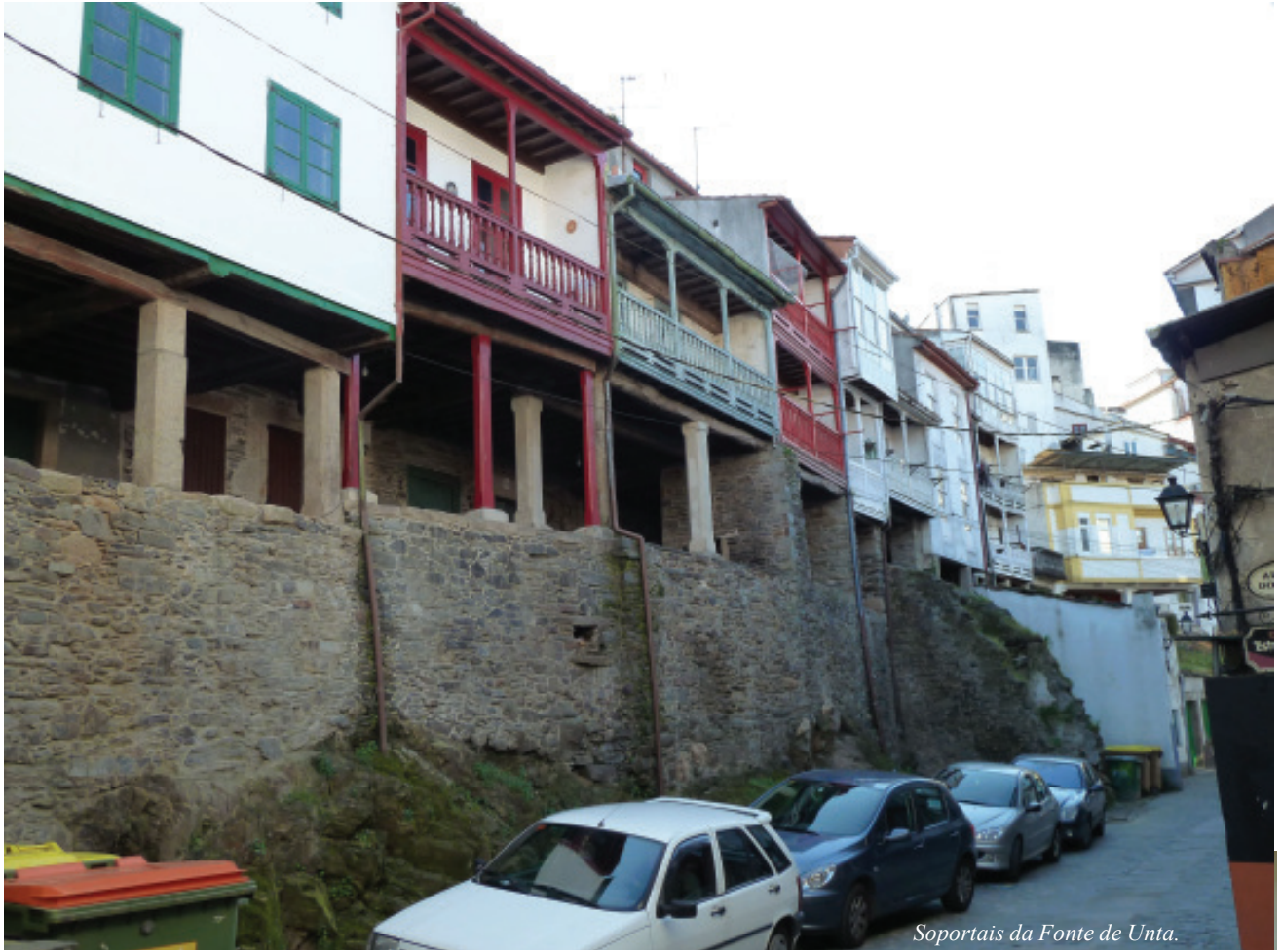
Soportais da Fonte de Unta.