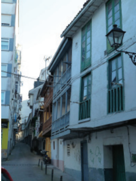
Rúa da Cruz Verde.