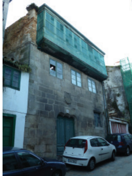
Rúa da Cerca.

tamén o barrio/entorno e a súa rivalidade foi motivo de disputas (coa conseguinte duplicidade do oficios e mercado). Completando este conxunto, aparecen «extramuros» as ordes mendicantes, ademais de San Francisco, Santo Domingo. Logo tamén as Agustinas Recoletas que, xunto ca igrexa de San Roque, ordenaban os bordes da cidade.