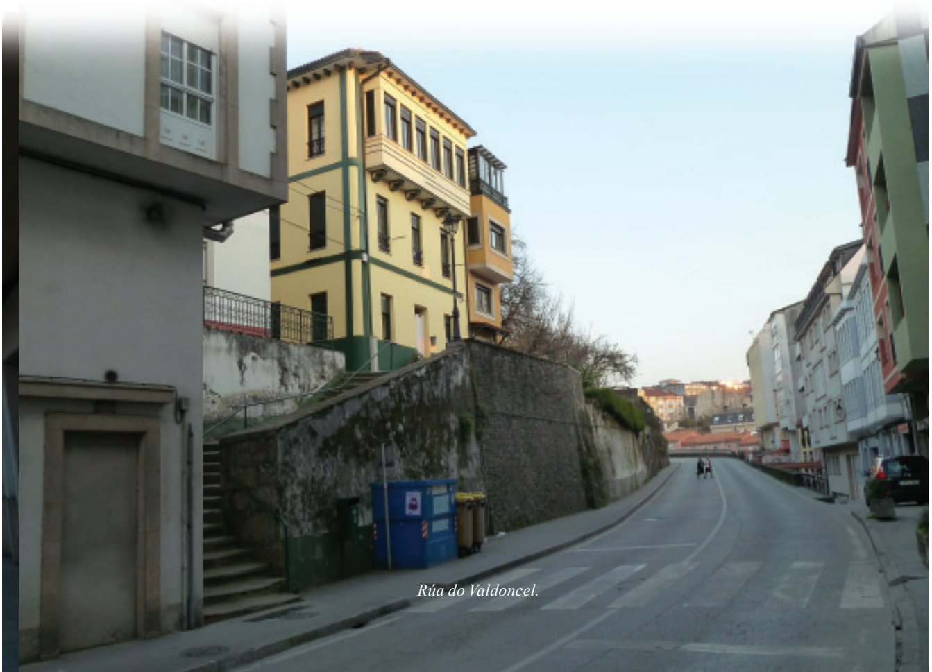
Rúa do Valdoncel.

A igrexa, sempre presente de xeito destacado nas comunidades agrícolas, destaca aquí, pois tres dos templos máis significativos do románico tardío galego atópanse nesta cidade: o convento de San Francisco (do que só queda o templo), e as igrexas de Sta María e de Santiago. Construídas no derradeiro tercio do século XIV, e probablemente polos mesmos gremios e albaneis (repetición de motivos relixiosos, o mesmo xeito de facer os relevos, similar estilo arquitectónico...) constitúen un conxunto monumental único, que destaca sobre o tecido residencial. Sta María e Santiago, por ser parroquias, organizaron