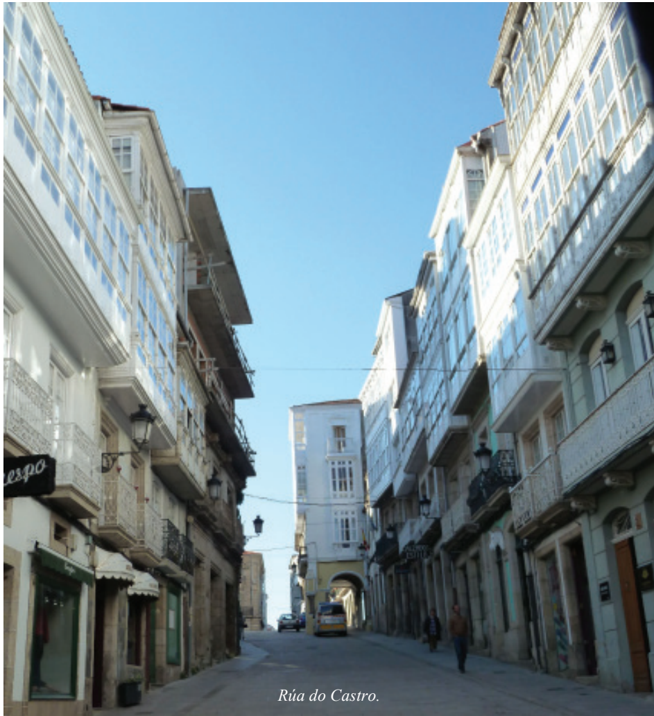
Rúa do Castro.

transporte e de mobilidade que inflúen no conxunto urbano e un grande potencial territorial e de futuro.