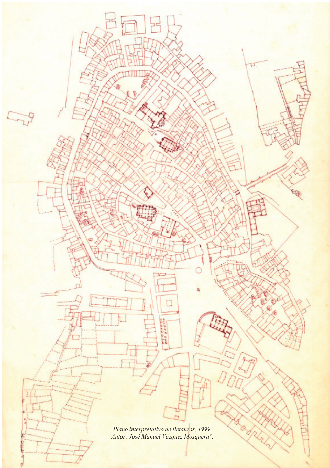
Plano interpretativo de Betanzos, 1999. Autor: José Manuel Vázquez Mosquera©.