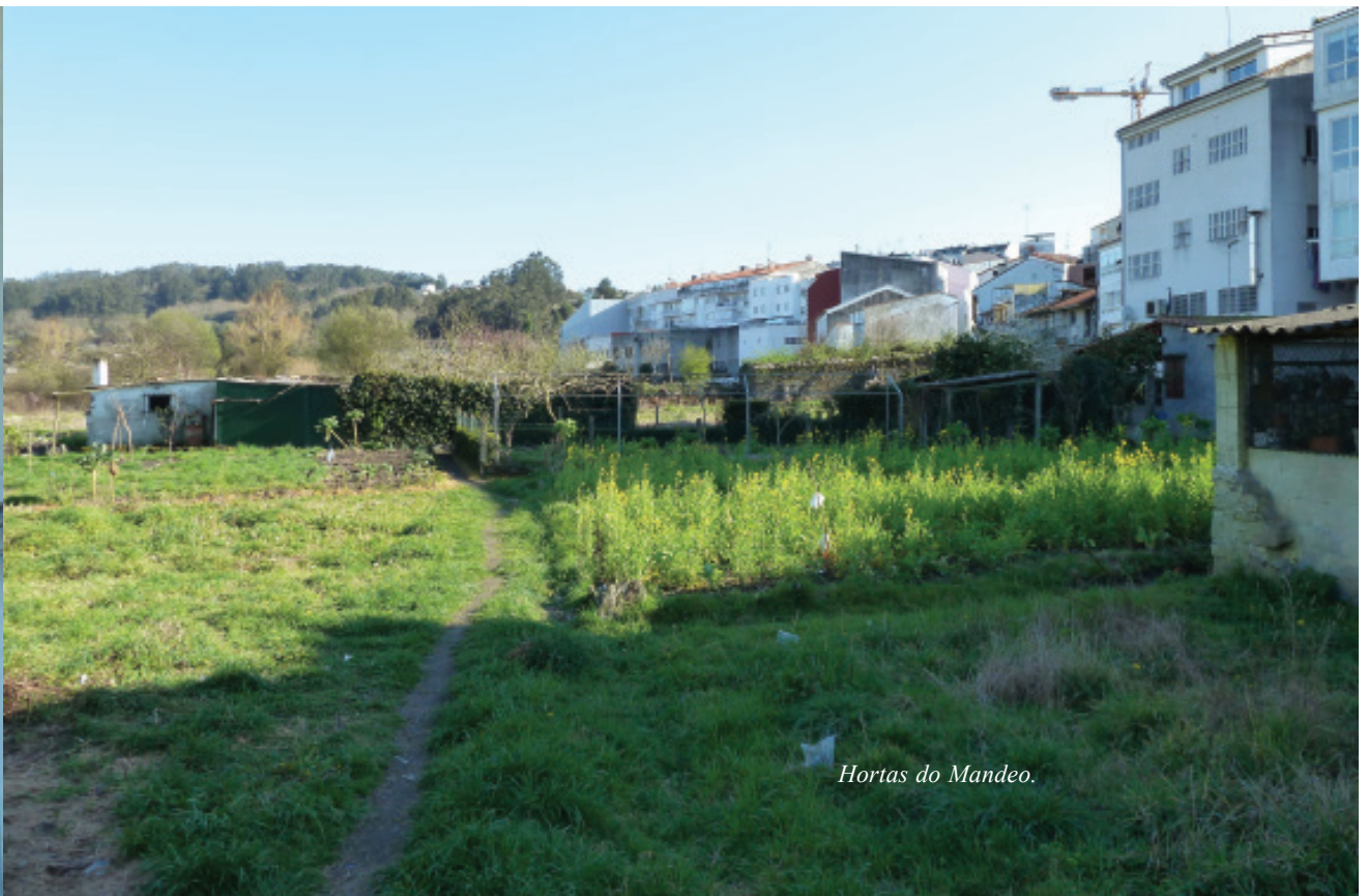
Hortas do Mandeo.