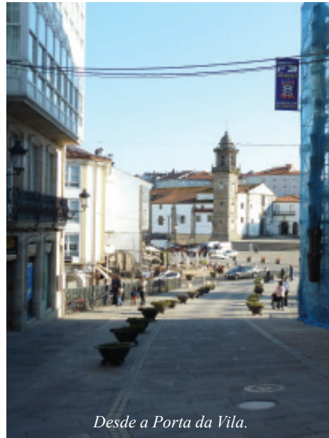
Desde a Porta da Vila.

Betanzos, desde a orixe, colonizou un espacio singular/referencial (castro de Unta) e un territorio/entorno agrario de gran riqueza. Como no resto de Galicia, nesta poboación conviviron, en distintas épocas, distintos pobos, gremios e clases sociais, complementándose e compartindo espacio e cultura, que foron deixando vestixios na construción de edificios e espacios público/colectivos ó longo do tempo. Así, agri-