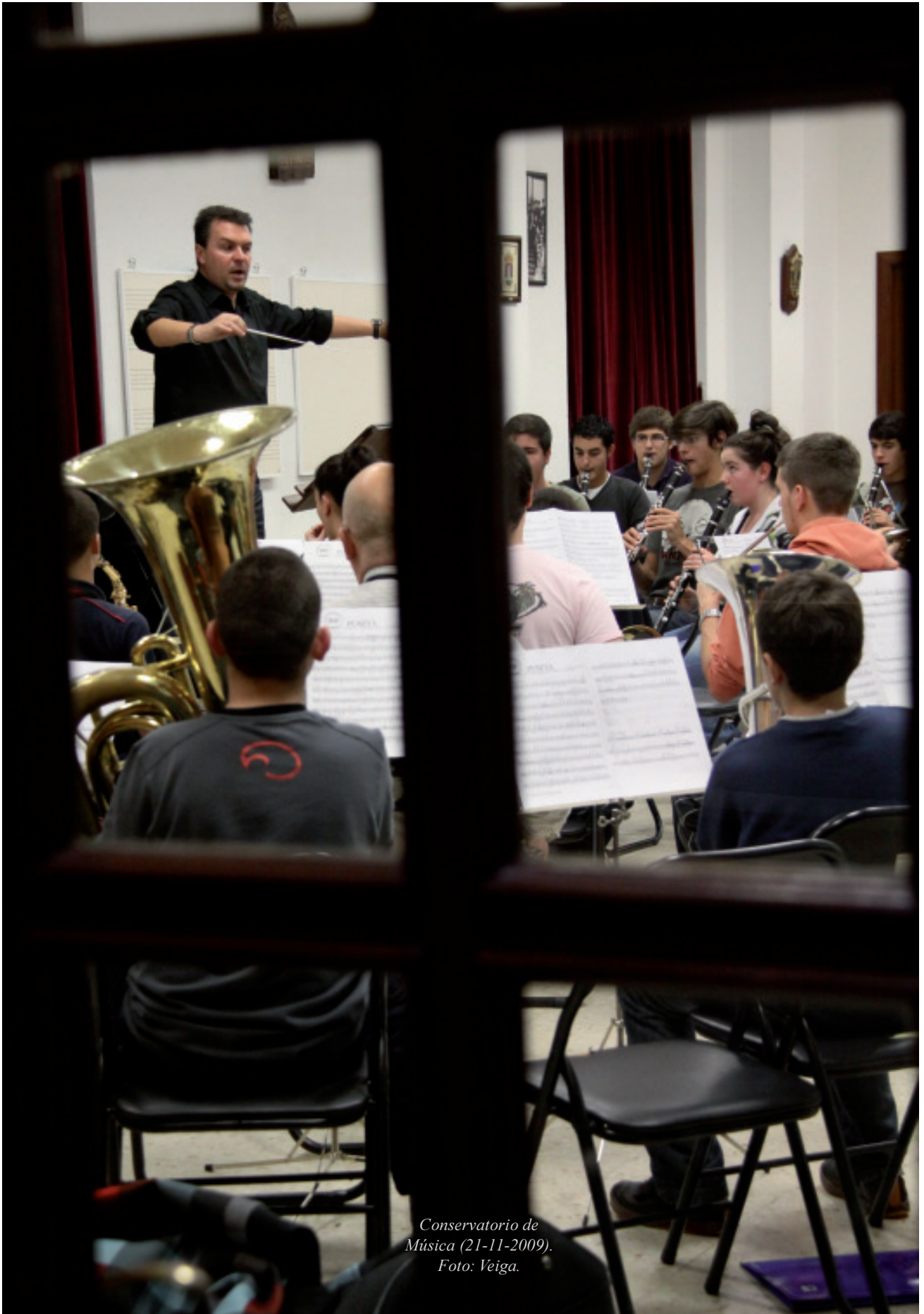
Conservatorio de Música (21-11-2009).