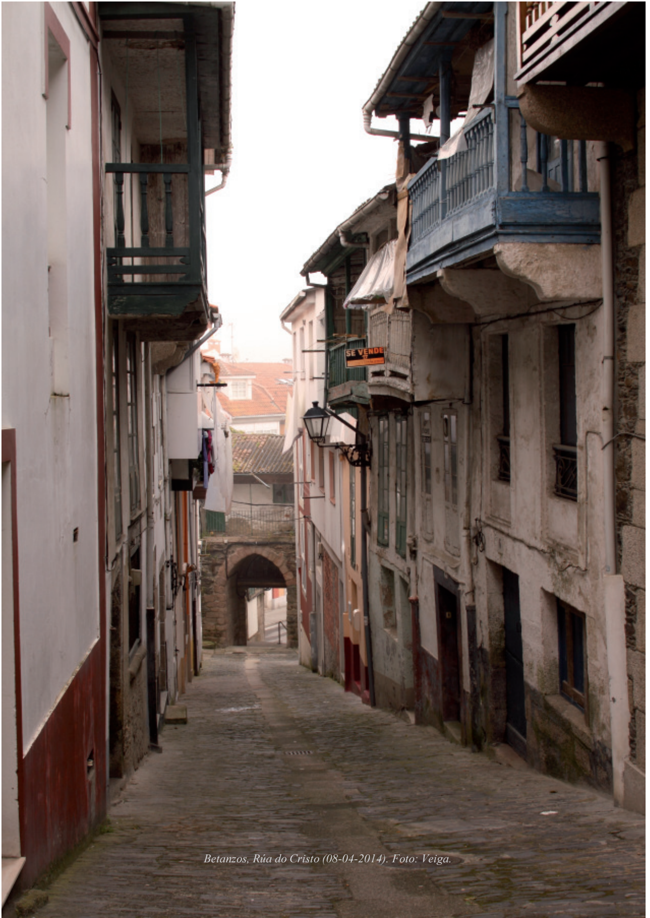
Betanzos, Rúa do Cristo (08-04-2014).