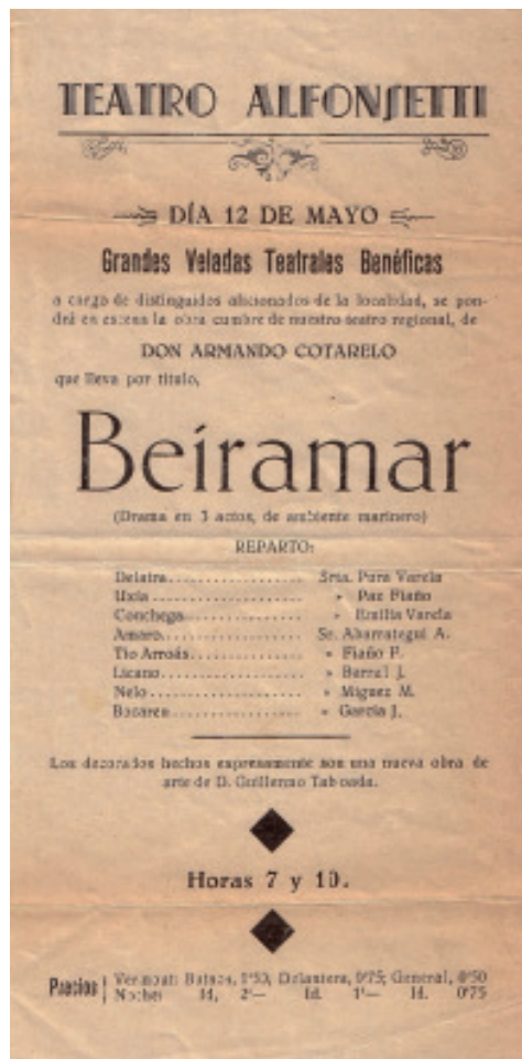
12.- De la web: Os libros de Anxel Casal.blogspot.com.