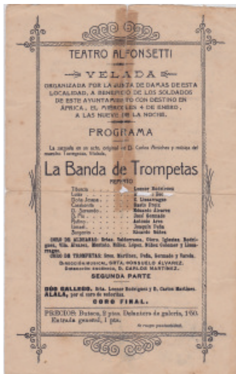
3.- Programa de mano. Tamaño: 20,5 x 13 cm.

La función que habría de corresponder al domingo nueve por la noche fue suspendida al surgir diferencias entre los componentes de la compañía. El día trece dieron la función de despedida con «Receta infalible», «Para la casa de los padres» y «La indiana»; como siempre, se distinguió la Sra Morelli. Esta acabó separándose de la compañía y, con el auxilio de varios jóvenes de la ciudad, dio una función al domingo siguiente con escaso público debido a lo avanzado de la Cuaresma. 28 Pero el cuadrilo de zarzuela formado por aficionados y profesionales, en el que descollaba la Morelli, puso en escena para el Domingo de Pascua «La gallina ciega» y «La nieta de su abuelo». El teatro estaba lleno y unos y otros actores desempeñaron con acierto sus papeles. El de la nieta, por la Morelli, fue primoroso. El jueves se ofrecieron «Un gatito de Madrid», «Lo pasado pasado» y «Chatêau Margaux». 29 Al domingo siguiente, tuvo lugar la función a beneficio de los Sres.