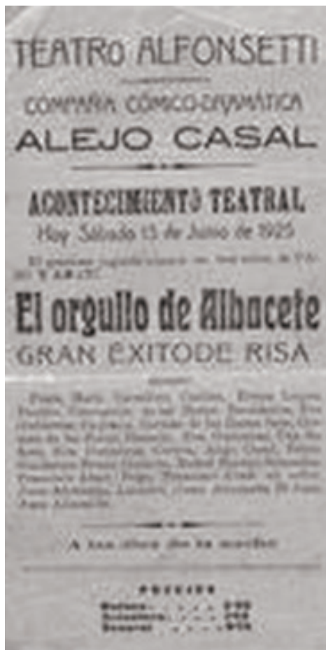
7.- Programa de mano publicado en la web de la Biblioteca Digital de Castilla y León. Tamaño: 18,15 x 10 cm.