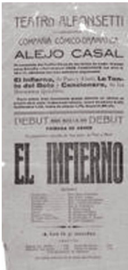
6.- Programa de mano publicado en la web de la Biblioteca digital de Castilla y León. Tamaño: 22 x 11 cm.