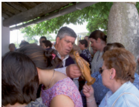
Foto 24. Ritual de poñer o Santo.- Ano 2006.