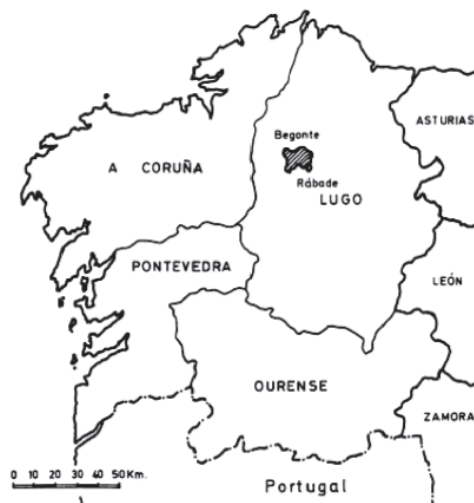
Localización xeográfica dos concellos de Begonte e Rábade.

Por outra banda, o fenómeno relixioso popular tenta dar solución ás necesidades