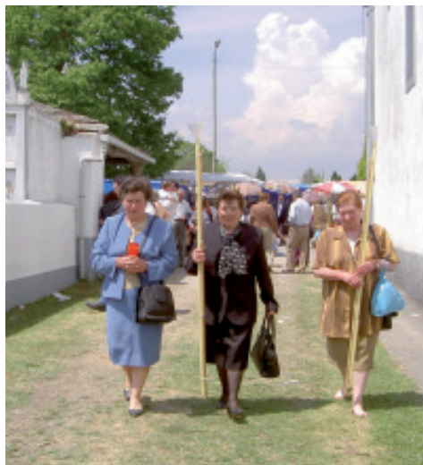
Foto 12.- Devotas percorrendo o perímetro do recinto sacro portando exvotos de cera.