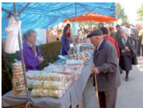
Foto 19.- Posto de rosquillas.