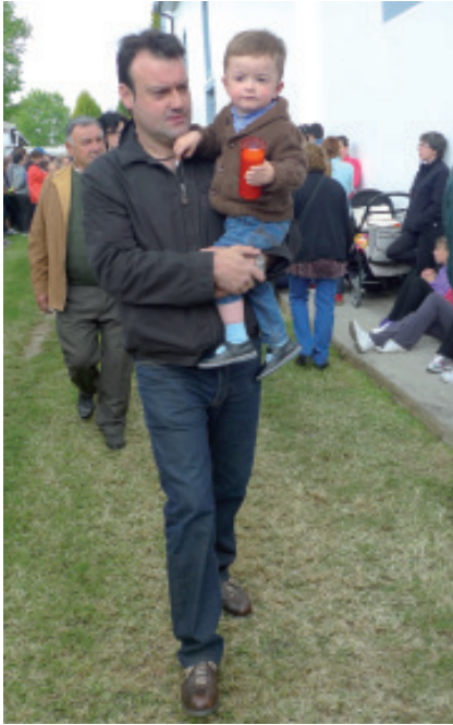
Foto 21.- Ritual de Circunvalación.