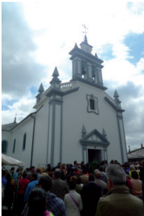
Foto 1.- Vista exterior do Santuario dos Milagres de Saavedra. Ano 2013.

A freguesía configurouse na Baixa Idade Media- principios do século XIV- arredor dunha fortaleza pertencente á casa de Saavedra. Esta casa, tivo as súas orixes en Taboí (Outeiro de Rei), preto do emprazamento da igrexa actual e pertencente ao coto e señorío de D a Xoaquina de Oca, dama que nomeaba naquel tempo e dentro dos seus dominios o cargo de xuíz ordinario. Dende as súas orixes, disfrutou dun gran poderío, xa que chegou a ter – segundo Vasco de Aponte 11 - oitocentos vasalos. Logo, a fortaleza dos Saavedra foi destruída durante a revolta irmandiña, manténdose os seus restos ata hai pouco tempo. A proxección desta casa foi moi relevante, como queda reflectido nos innumerables persoeiros ligados coa mesma, entre os que podemos distinguir pola súa maior ligazón coa casa de Begonte aos seguintes: D. Francisco Saavedra, rexidor da cidade de Mondoñedo a mediados do século XVI; D. Pedro de Saavedra, capitán e rexidor da mesma cidade en 1627; Don Diego Saavedra Osorio, deán da catedral de Mondoñedo en 1639; D. Francisco Antonio Saavedra y Rigueiro, capitular do Concello de dita cidade en 1716; D. Felipe Diego Saavedra Cotón, sargento maior das Milicias de Lugo, e co grado de tenente