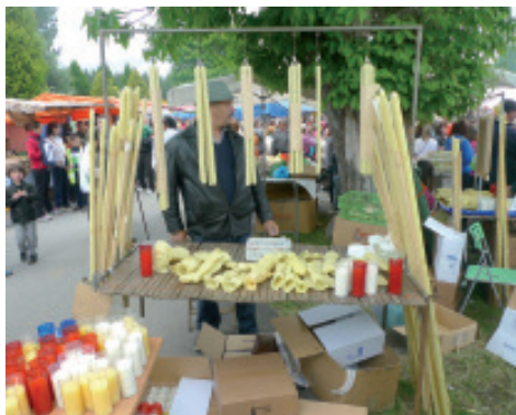
Foto 11.- Posto de exvotos de cera. Ano 2013.