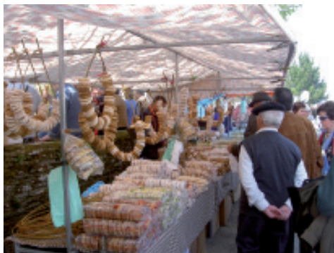
Foto 23.- Rosquilleiras.