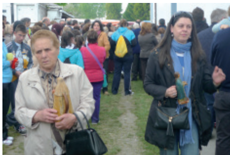
Foto 3.- Dúas devotas portan imaxes pequenas dos Milagres. Ano 2013.