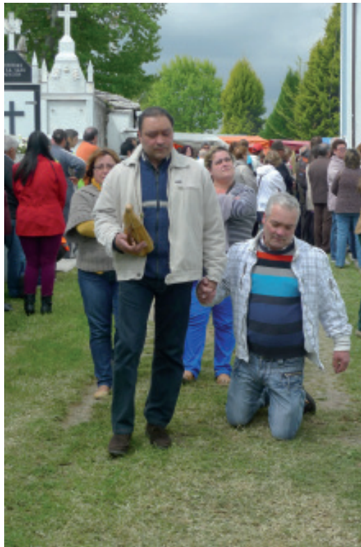
Foto 25.- Ritual de xeonllos.