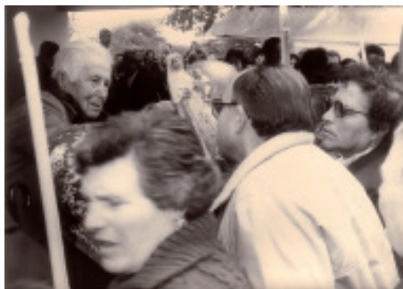
Foto 7.- Ritual de poñer o Santo. Medios dos 80.

Finalmente, unha cruz que mostra unha sección cuadrangular no seu extremo inferior e coas arestas achafranadas no resto. Ademais, os extremos dos seus brazos e da cabeceira son do tipo de cruz florenzada. No anverso, baixo unha cartela, está a efixie de Cristo, que amosa os seguintes trazos: unha coroa de espiñas na cabeza, que está inclinada ao lado dereito; os brazos están estendidos ao longo da cruz e as súas mans aparecen abertas; o perizoma anóase ao lado dereito; e as pernas, levemente flexionadas, mostran o pé dereito por riba do esquerdo, e ámbos os dous sobre unha caveira. No reverso, está a efixie da Virxe, vestida cunha túnica e manto e, que amosa as mans cruzadas sobre o ventre 16 .