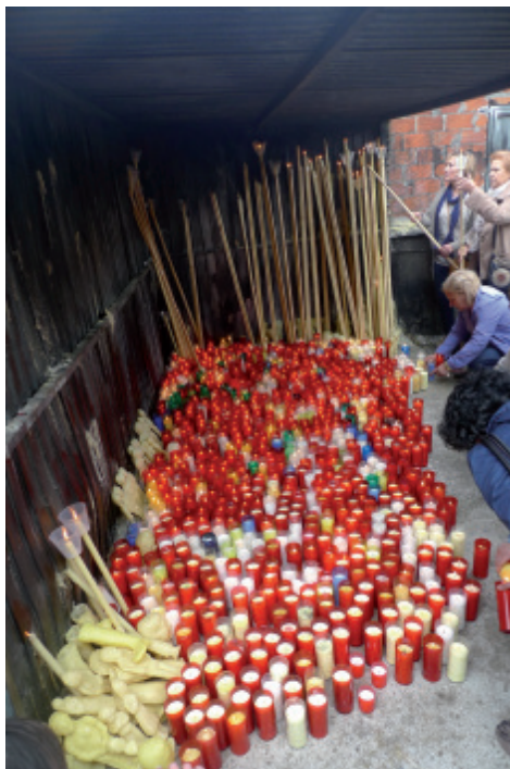
Foto 13.- Os devotos deixan exvotos de cera baixo un alpendre situado ó carón do Santuario.

« A Virxe dos Milagres te libre de tódolos males. Amén»