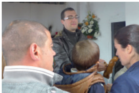
Foto 9.- Ritual de poñer o Santo. Ano 2013.