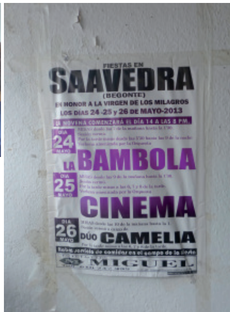
Foto 10.- Cartel anunciando a festa relixiosa e profana de Saavedra.