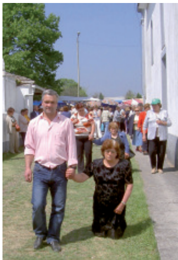
Foto 4.- Dúas devotas percorren de xeonllos o perímetro do Santuario.