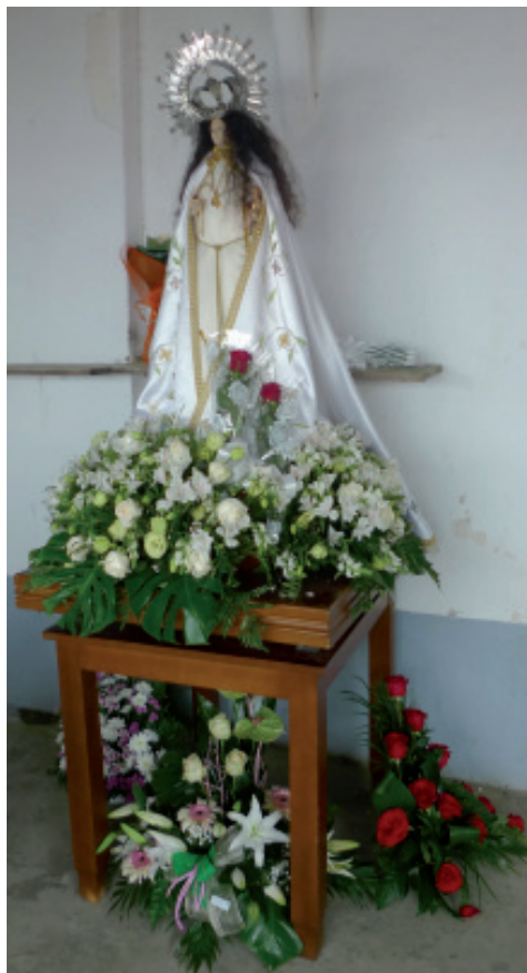
Foto 2.- Advocación mariana dos Milagres. Ano 2013.