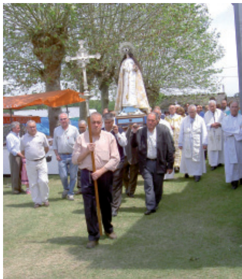
Foto 16.- Ritual procesional.

fonte ligada ao culto á Virxe. Neste lugar pediu aos seus gardas que lle deixasen beber, ao que estes accederon. Isto deu lugar a que as cadeas coas que viña preso caesen aos seus pés. Pero os gardas volveron poñerllas, sendo conducido ao santuario. Alí, ao rezar as primeiras oracións, volvéronlle caer as cadeas, quedando deste xeito, para confusión dos seus acusadores e sen necesidade de xuízo, demostrada a súa inocencia. Este señor, logo de varios anos, morreu, sendo enterrado no lado esquerdo do altar. Díse que o día do seu enterro a comitiva cubría unha distancia de tres quilómetros.