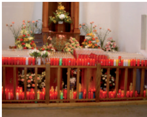
Foto 14.- Cera acesa no interior do recinto sacro.