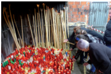
Foto 18.- Os devotos deixan exvotos baixo un alpendre existente ó carón do Santuario.

«¿Qué más diré en tu alabanza ¡ oh Virgen Inmaculada! de virtudes coronada, de los hombres la esperanza, y de toda su bonanza, Madre mía Milagrosa?»