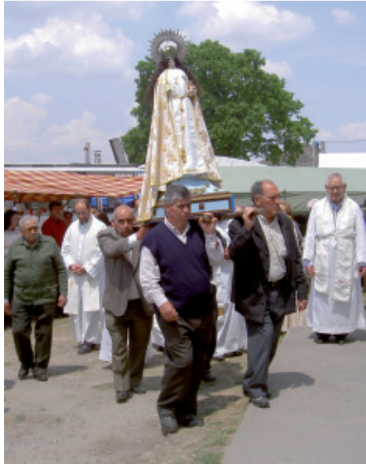
Foto 22.- Ritual procesional.