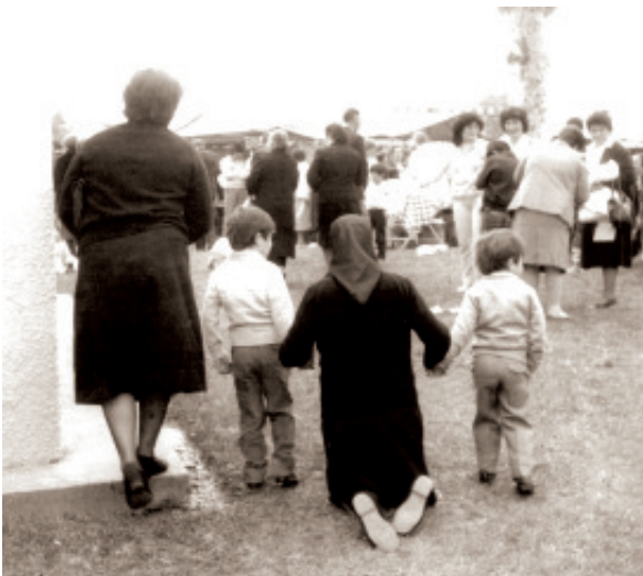
Foto 5.- Unha devota da unha volta ou máis ó redor so recinto sacro de xeonllos. Mediodos dos 80.