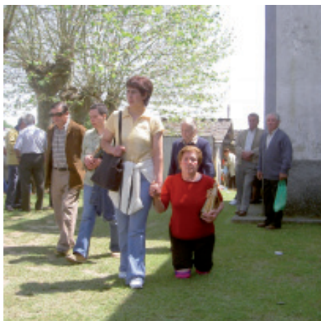
Foto 17.- Ritual de xeonllos. Ano 2006.

«En este lugar dejaste tu imagen consoladora, en Saavedra, ¡ oh, gran Señora! parece que señalaste ser Vos sola Milagrosa»