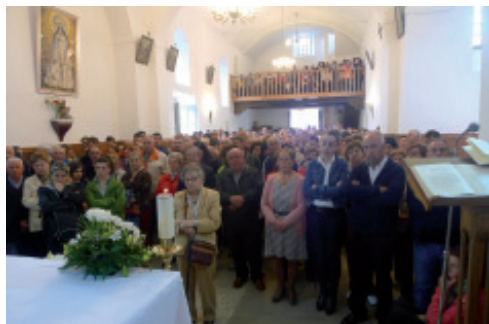
Foto 6. Devotos oíndo unha das misas que se ofician no Santuario.