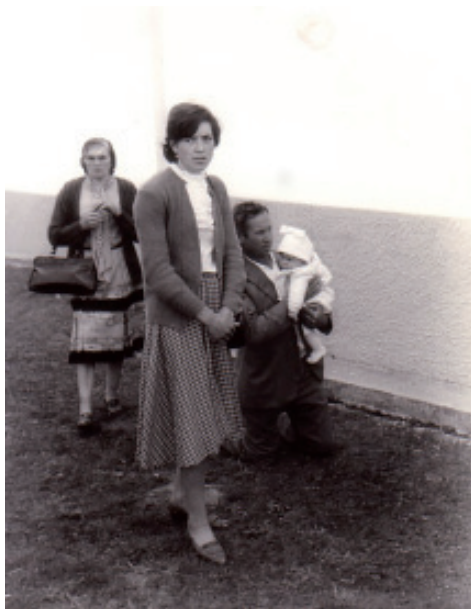
Foto 15.- Ritual de xeonllos ó redor do Santuario. Mediados dos 80.