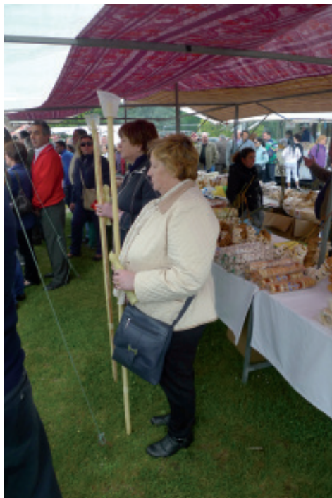
Foto 8.- Devotas oindo misa con candeas da súa mesma altura.

As promesas máis usuais, que se realizan neste santuario, están ligadas ao cumprimento de diferentes rituais e ofrendas.