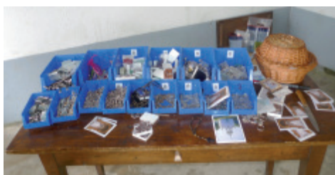
Foto 20.- Variedade de obxectos relixiosos postos á venda.