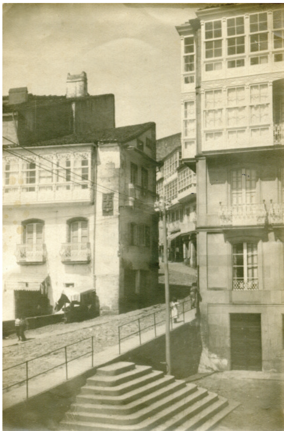
A Porta da Vila antes do ensanche de 1905.