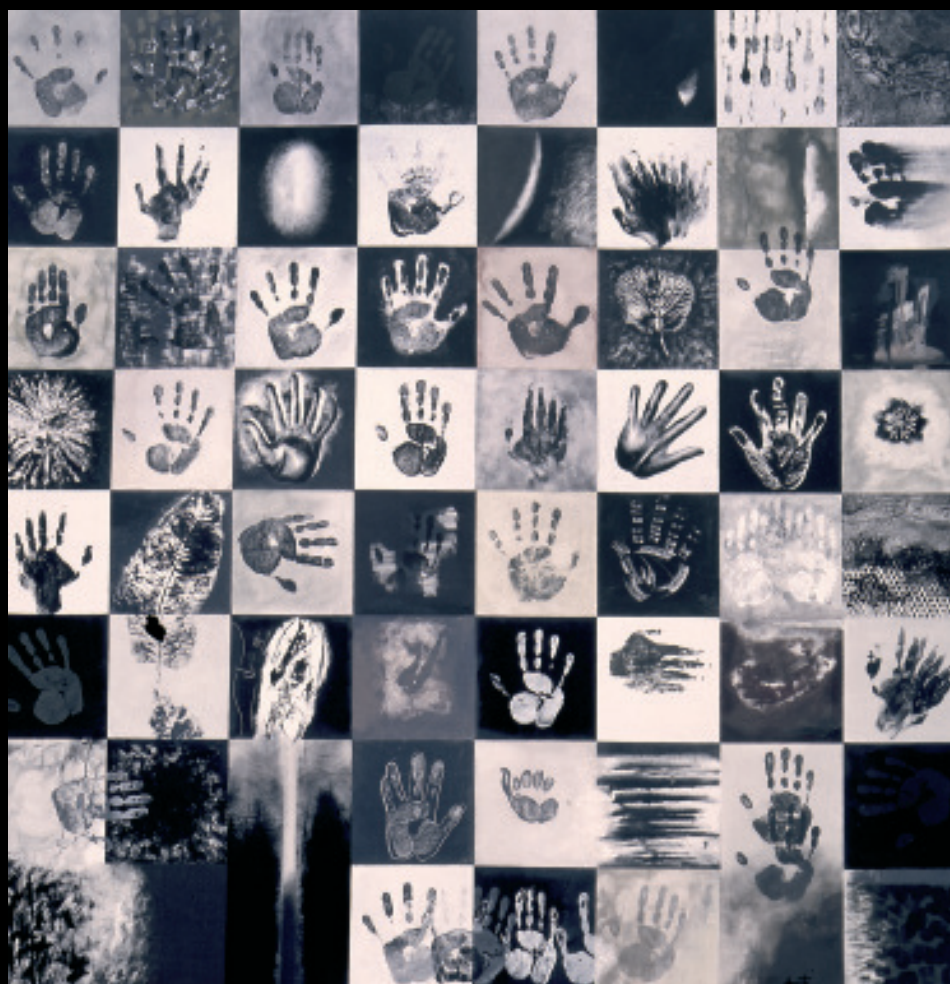
Alfonso Costa. Identities. 195x195cm. 2000.