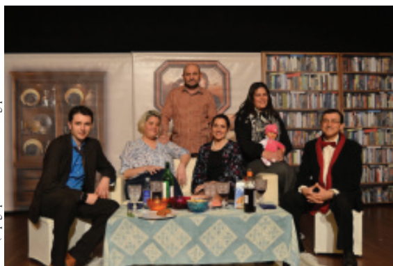
( http://gugupacionteatralmariñan.blogspot.com )