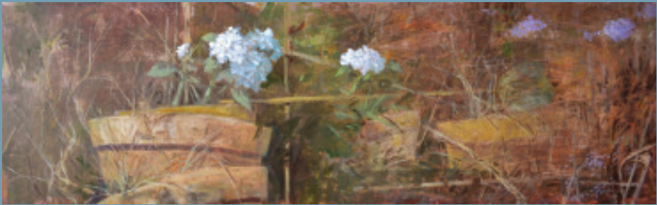
Javier Garaizábal Jardín abandonado 26X85 cm