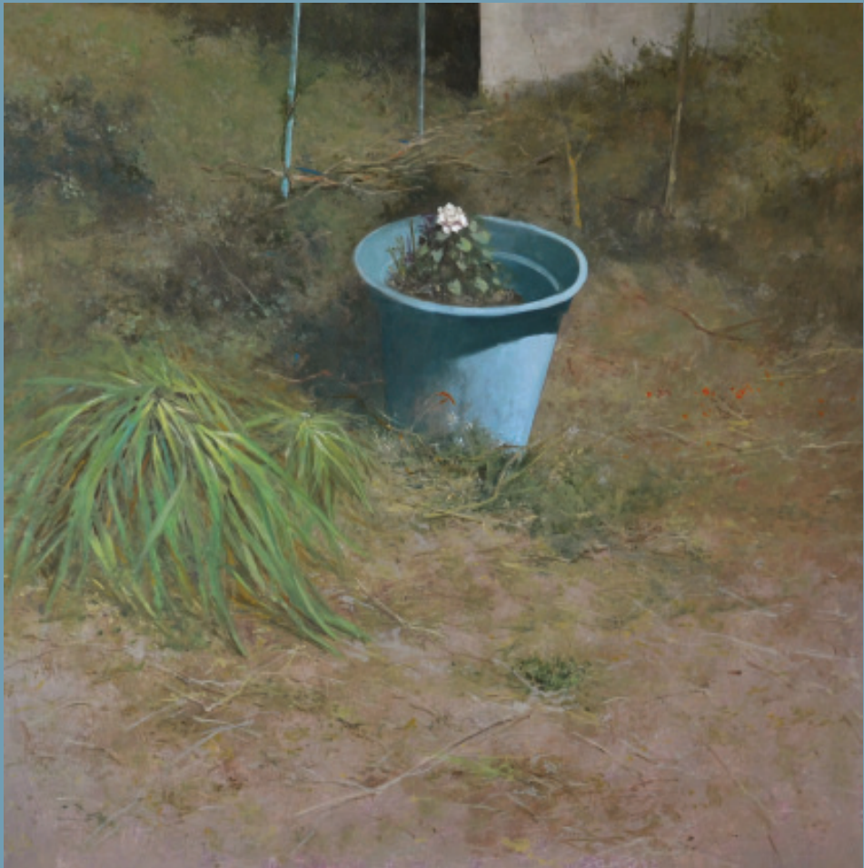
Javier Garaizábal 81X81 cm. Maceta abandonada