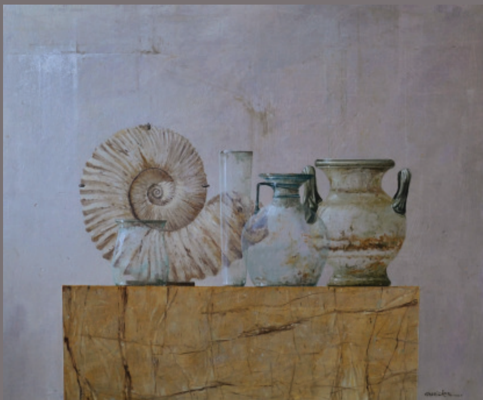
Javier Garaizábal Bodegón con ammonite. 50X61 cm