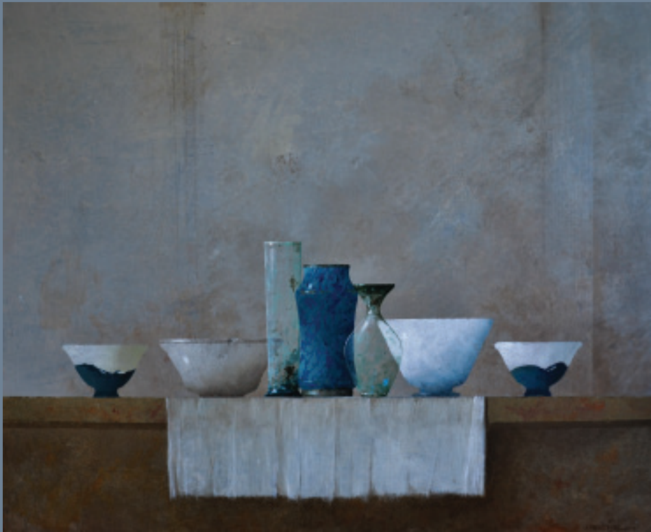
Javier Garaizábal Paño 40X80 cm