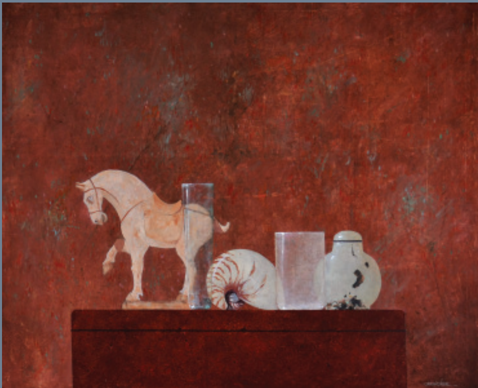
Javier Garaizábal Bodegón con caballo chino 50X61 cm