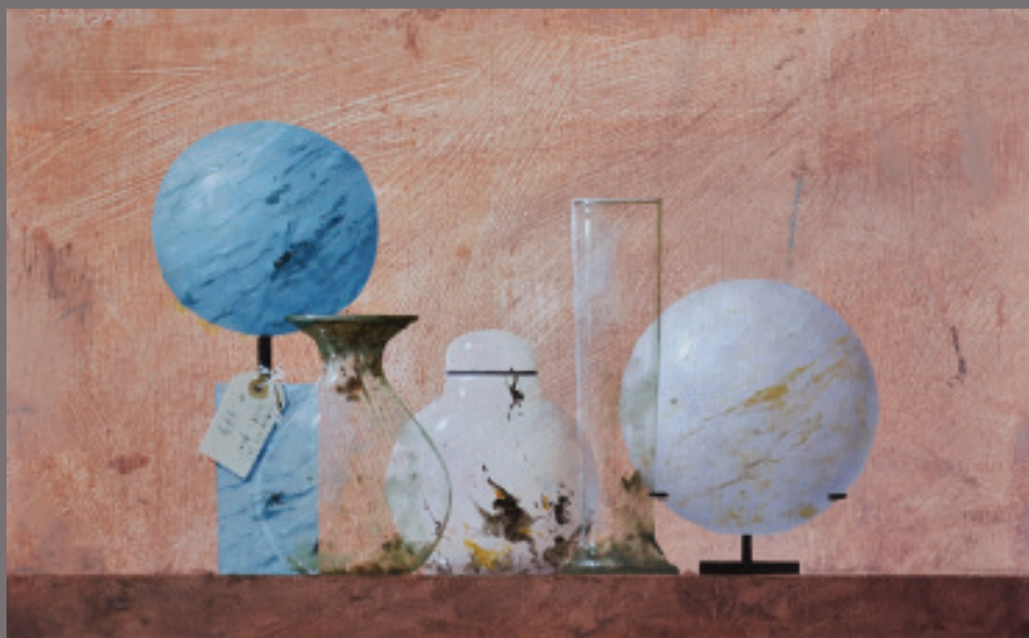
Javier Garaizábal Bodegón con esfera 26X42 cm