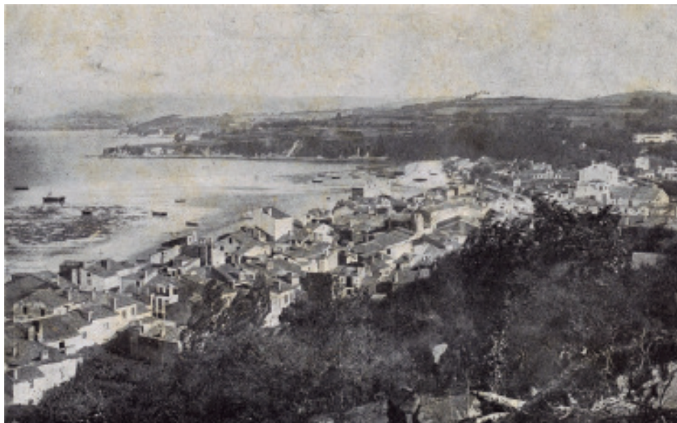
Vista de Sada tomada de Vida Gallega , 15-10-1924.