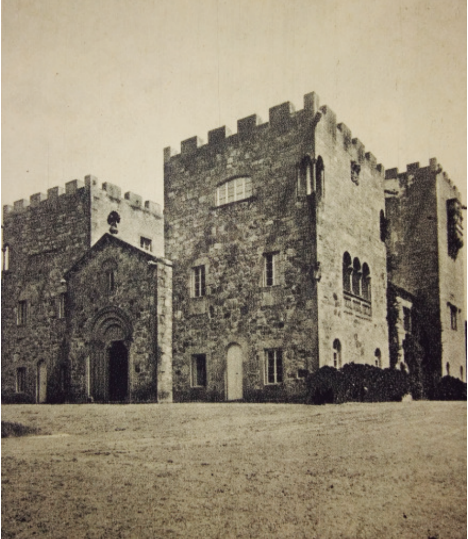
4 As Torres de Meirás na época en que tivo lugar o conflito.

expoñéndose a importantes prexuízos: sancións económicas, detencións, vinganzas persoais... Dúas familias, nunha situación extrema como é a da perda do seu medio de vida, rebélanse contra aquel a quen inculpan desta situación, e a veciñanza solidarízase ata o punto de asumir o problema como propio.