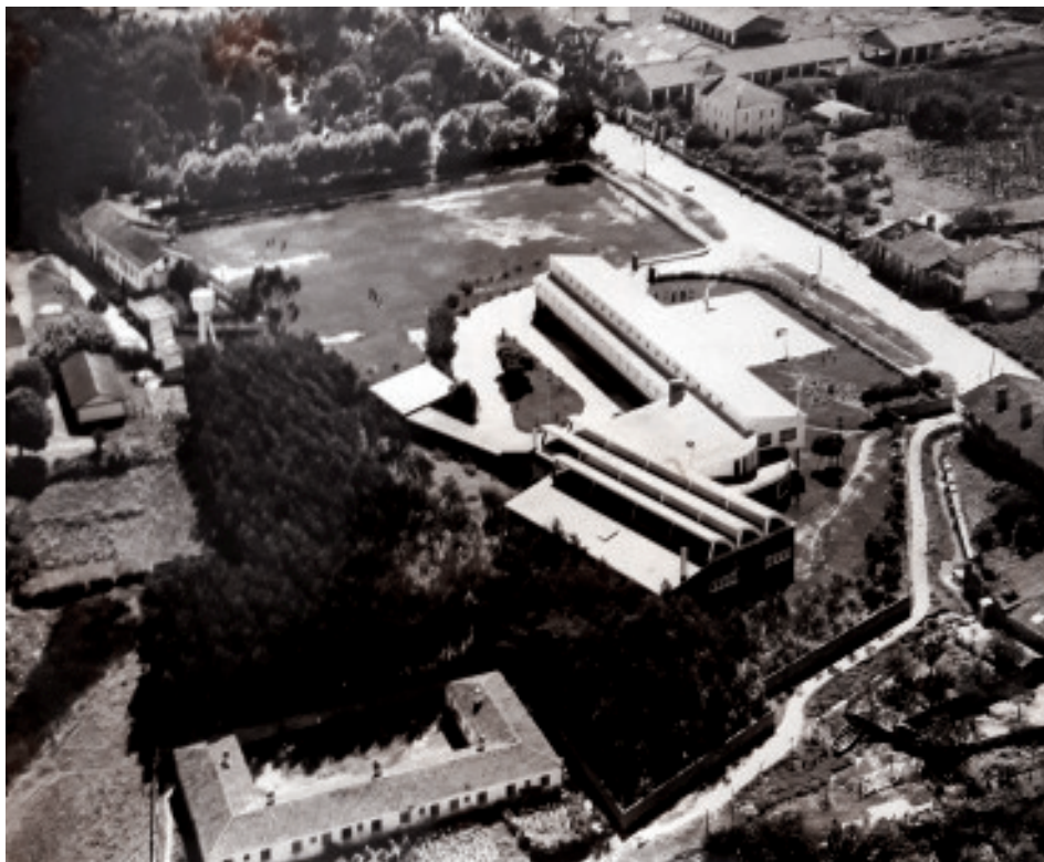
Fig. 43 A Casa da Rega e o Instituto Laboral co campo de fútbol dominando a antiga panorámica da Magdalena.