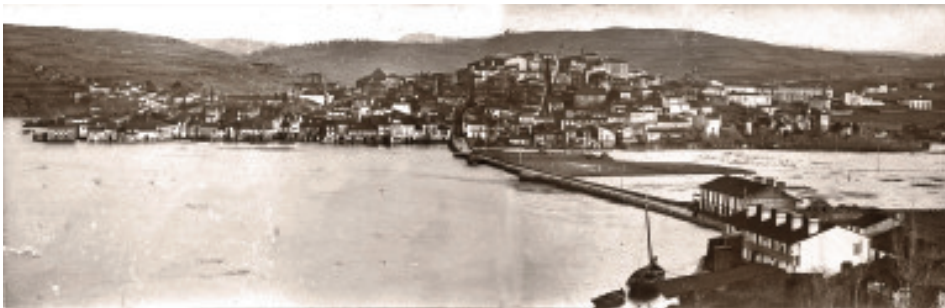
Fig.3 Vista xeral de Betanzos cas casas da Magdalena en primeiro termo. a comezos do século XX.

Depositado xa no seu día no Arquivo Municipal de Betanzos, o arquivo fotográfico conta con máis de trescentas imaxes procedentes dos arquivos privados de diferentes veciños e ex-veciños desta zona. A maiores hai que incluír un basto repertorio de imaxes cedidas no seu momento polo propio Arquivo Municipal de Betanzos. Como acontece moitas veces ao traballar con este tipo de fondos, descoñecemos numerosos aspectos da súa creación, especialmente aqueles que nos axudan a datar moitas das fotografías, para o que nos teremos que valer do reflectido nas imaxes.