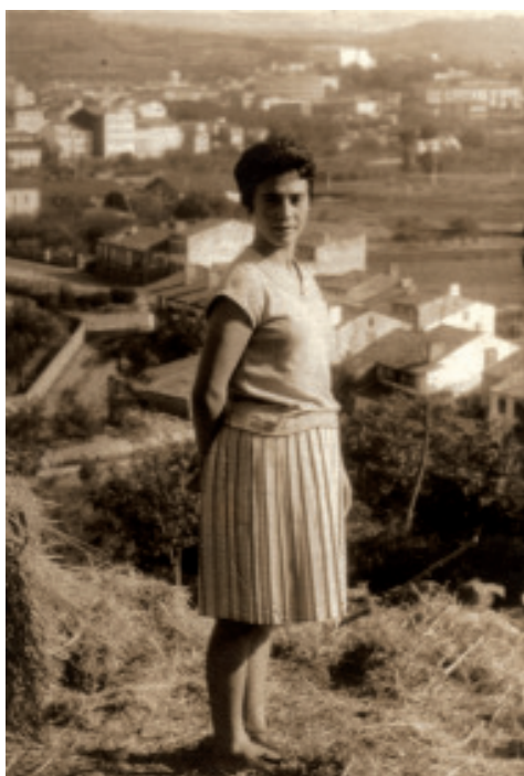
Fig. 55 Retrato no alto da Condomiña, coas antigas casas da Magdalena ao fondo.