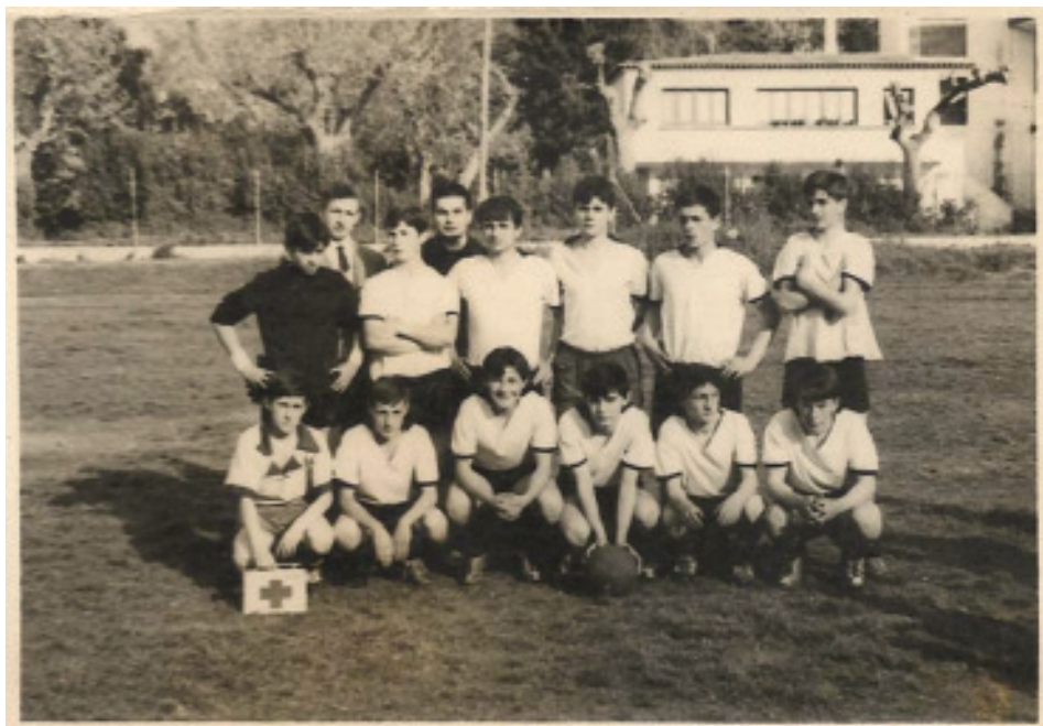
Fig. 36 Equipo de fútbol formando no campo do Instituto Laboral coa casa sindical ao fondo.