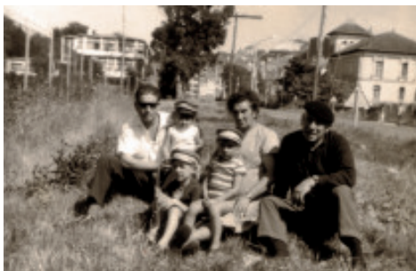
Fig. 35 Familia no barrio da Magdalena ante a casa sindical e a Casa da Rega.