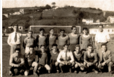
Fig. 30 Primeiro campo de fútbol, coa costa que sube ás Angustias ao fondo