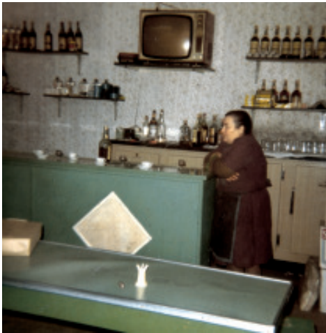
Fig. 45 Interior de Bodegas Barral no establecemento que ocupou entre 1973 e 1999.