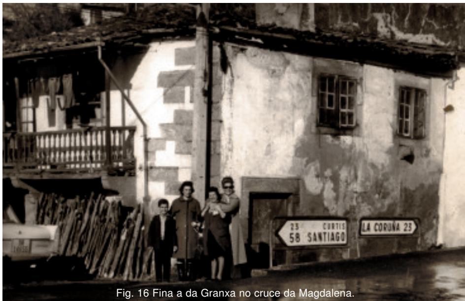
Fig. 16 Fina a da Granxa no cruce da Magdalena.