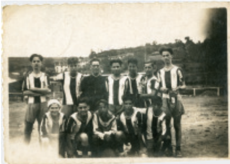
Fig. 29 Primeiro campo de fútbol, coas casetas da Condomiña ao fondo

Pero como todos os investimentos dese tempo, a demora e a falta de resultados estiran no tempo o traslado do campo. Veremos como en 1958 18 o tradicional partido de fútbol das festas de San Roque vaise celebrar no campo da Granxa, mentres que ao ano seguinte, o 25 de novembro de 1959, «se reunieron con el Alcalde de la ciudad, Tomás Dapena Espinosa, vecinos de la localidad relacionados con el deporte con el fin de formar una directiva y poder conseguir una ayuda económica». Isto parece chegar a bo porto xa que o 9 de abril de 1961 ten lugar a inauguración do campo do Carregal, de menos dimensións que o anterior, onde se tiña comezado a temporada. O acto festivo da inauguración contou cun partido amigable contra o Sporting Cambre.