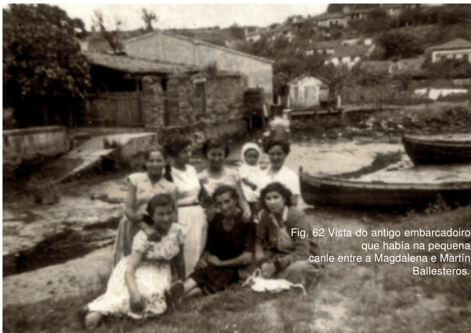
Fig. 62 Vista do antigo embarcadoiro que había na pequena canle entre a Magdalena e Martín Ballesteros.