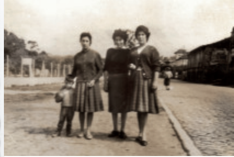
Fig. 58 Mulleres e neno pola Avenida da Coruña coa Casa da Rega.