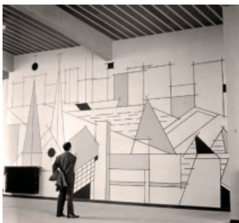
Fig. 38 Mural interior do Instituto Laboral. 24

Neste centro impartíanse, ademais das materias habituais do ensino secundario (linguas, latín, matemáticas, historia, formación relixiosa, formación do espírito nacional, etc.) os coñecementos básicos para o mundo agropecuario e todo tipo de formación nocturna para elevar o nivel cultural e técnico da súa contorna -con formación de economía doméstica para as mulleres-. En palabras de Tomás Dapena, alcalde franquista no momento da inauguración, serviría como «faro cultural de toda la comarca, con el cual se conseguirá desaparezca de nuestros límites el peón indocumentado y el vago pernicioso, lacras sociales que tan daño han hecho en diversas épocas a nuestra Patria» (Montero, Rodríguez, 2002: 494). En definitiva, tratábase de impulsar o proposto na lei do 16 de xullo de 1949, que buscaba implantar o ensino medio e profesional nos núcleos de Galicia que ata o momento carecesen de centros formativos, como era o caso de Vilagarcía, Noia, Tui, Mondoñedo, Lalín, Carballo ou Ribadeo, levando á práctica uns coñecementos teóricos e técnicos que permitisen agrandar o desenvolvemento local de cada urbe.