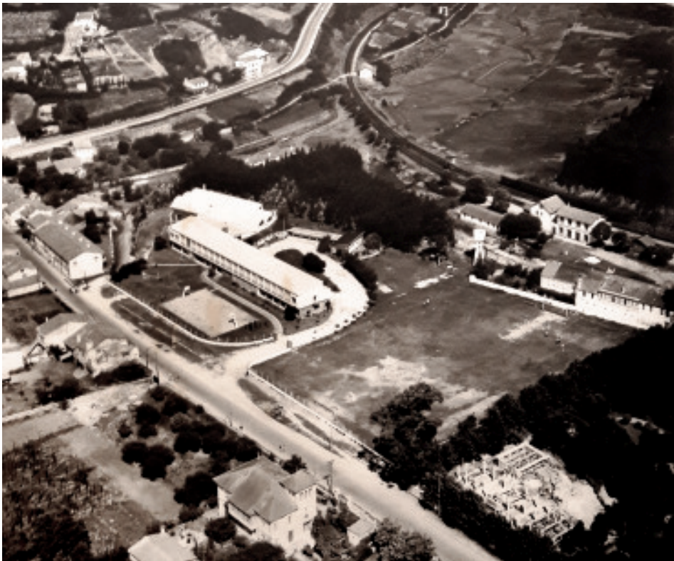
Fig. 37 A casa sindical, aínda en obras, nunha panorámica do barrio da Magdalena.

A súa modernidade contou dende os inicios co beneplácito da veciñanza. Por desgraza, e seguindo a liña decadente da maior parte dos edificios que foron referenciais dentro do barrio no século XX, non chegou a adquirir un estado ruinoso senón que directamente foi derrubado nos anos oitenta para trasladar a súa sede ao outro lado da estrada, ao actual IES Francisco Aguiar. No medio do edificio contemporáneo aínda podemos apreciar a herdanza das chamadas porquerizas , o derradeiro elemento vivo do Instituto Laboral que ocupaban os campos de experimentación cos que contaba o centro na outra beira da estrada.