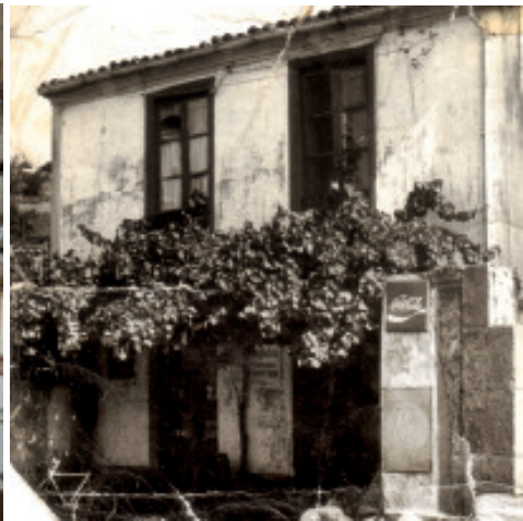
Fig. 46 Antiga construción de Bodegas Barral, en pé ata 1973.