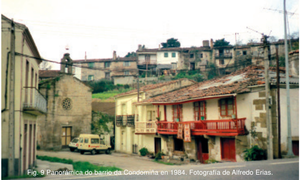
Fig. 9 Panorámica do barrio da Condomiña en 1984. Fotografía de Alfredo Erias.