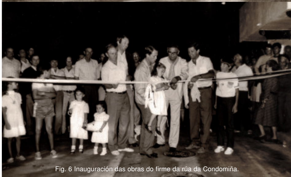
Fig. 6 Inauguración das obras do firme da rúa da Condomiña.