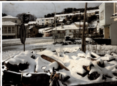
Fig. 18 Panorámica do barrio da Condomiña nevado a finais de 1987.