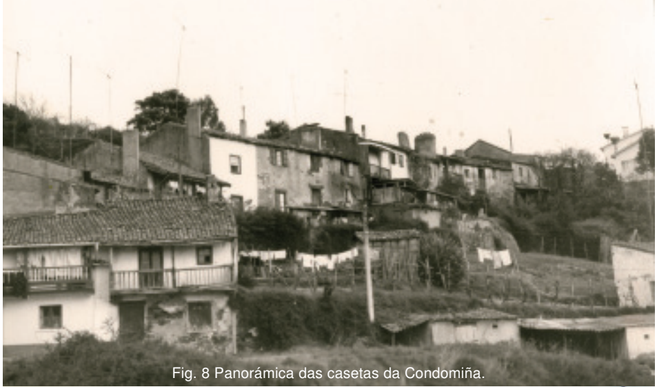
Fig. 8 Panorámica das casetas da Condomiña.