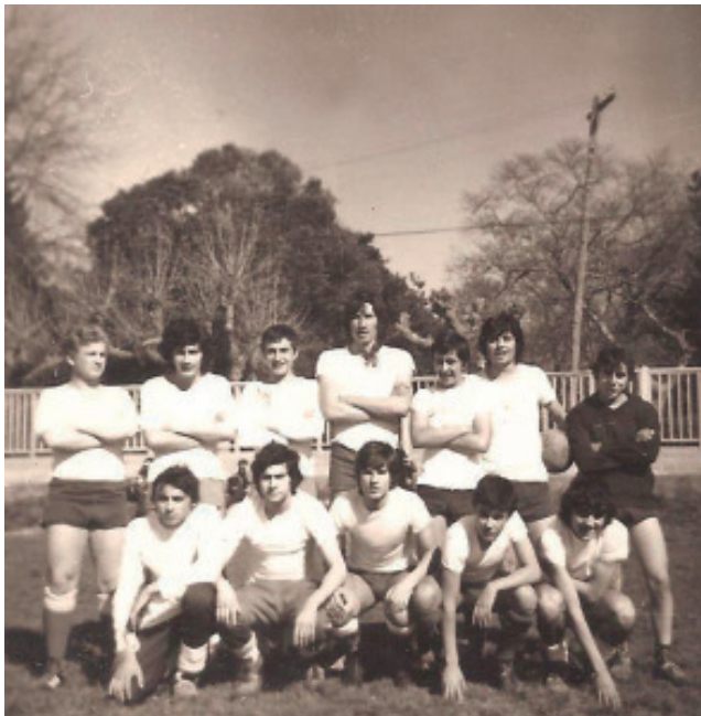
Fig. 31 Segundo campo de fútbol, dentro xa do Instituto Laboral 19 .