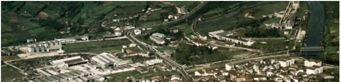
Fig. 50 Detalle dunha vista xeral de Betazos en 1977 na que se ve todo o barrio da Magdalena 28 .