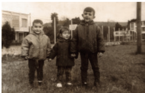
Fig. 34 Varios nenos diante do Instituto Laboral, coa casa sindical ao fondo.