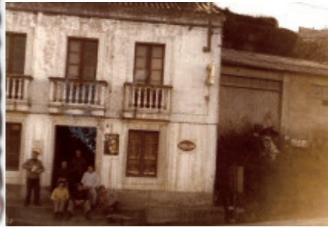
Fig. 59 O bar da Perla, de Manolo O Brigada.