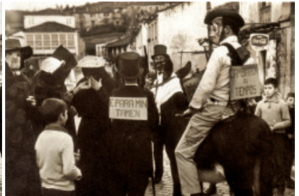
Fig. 51 Celebración do Entroido na Magdalena. Fig. 52 Celebración do Entroido na Magdalena.