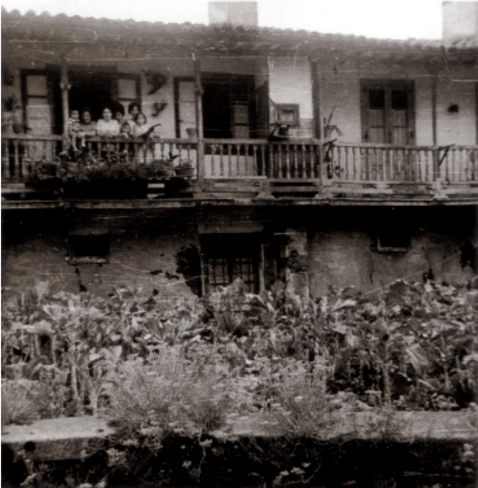
Fig. 63 Vista da parte traseira das antigas casas da Magdalena no camiño que leva a Martín-Balletero.

solidariedade cun barrio que xa nese momento se dedicaba á recollida da chatarra e o cartón. Pero trátase dun lugar que mudou moito no último século, xa que como podemos ver nas imaxes, o pequeno regato que desembocaba detrás das casas da Magdalena ou da Avenida da Coruña, facía de lugar de recreo improvisado para os máis pequenos.