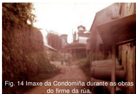
Fig. 14 Imaxe da Condomiña durante as obras do firme da rúa.