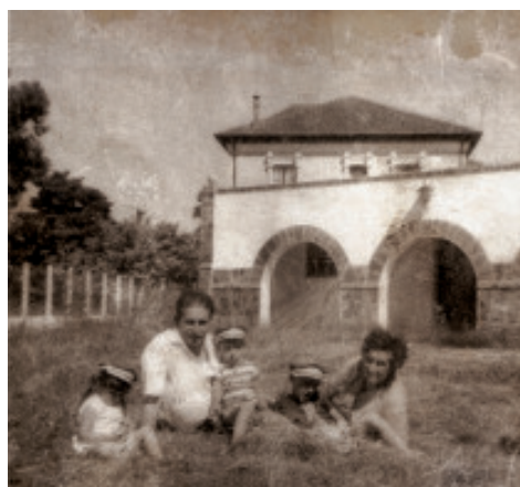
Fig. 39 Porquerizas do antigo Instituto Laboral.