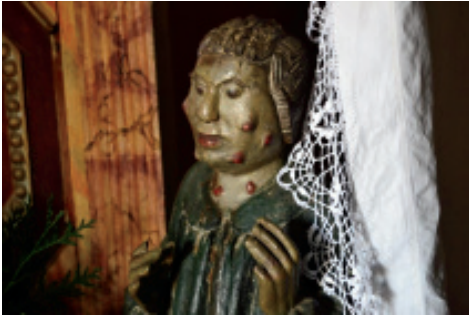
Fig 2. Imaxe do San Lázaro da capela da Condomiña.

a nosa identidade vaise transformando segundo as maneiras coas que somos tratados polo sistema cultural que nos rodea (Hall, 1998: 12), ou o que é o mesmo, o patrimonio que supón a nosa memoria colectiva de barrio -ao igual que o resto do patrimonio do lugar- precisa duns criterios de conservación para, polo menos, manter vivo o seu recordo.