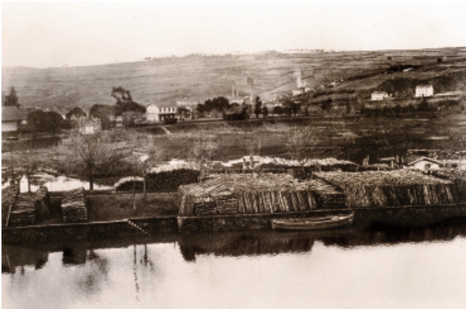
Fig. 23 Novo peirao coa estación de ferrocarril ao fondo.

Arredor da propia estación aparecerían tres grupos de construcións diferenciadas que poderemos ver máis adiante nunha imaxe aérea de todo o barrio da Magdalena. Nela destacan a propia estación e a cantina, separadas por un pequeno almacén no que por tempos tamén se gardaba o carbón das máquinas. Por detrás, e cunha formación similar á que teñen na actualidade, habería dúas vivendas de planta baixa que estarían ocupadas polos xornaleiros da RENFE (Vid. Fig. 37). E tirando máis cara á cidade, un grupo de vivendas levantadas pola familia De la Fuente daban cabida a varios irmáns da mesma liñaxe, tras establecerse na Ponte Vella a primeira saga familiar arredor da segunda década do pasado século. Estas vivendas serán as que vexamos limitando co campo de fútbol do Instituto Laboral 11 .