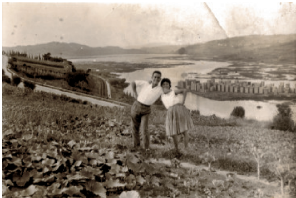
Fig. 25 Parella coa ría de Betanzos ao fondo.