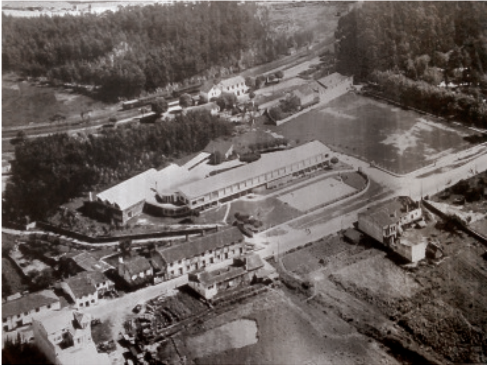
Fig. 49 Imaxe aérea do barrio da Magdalena.