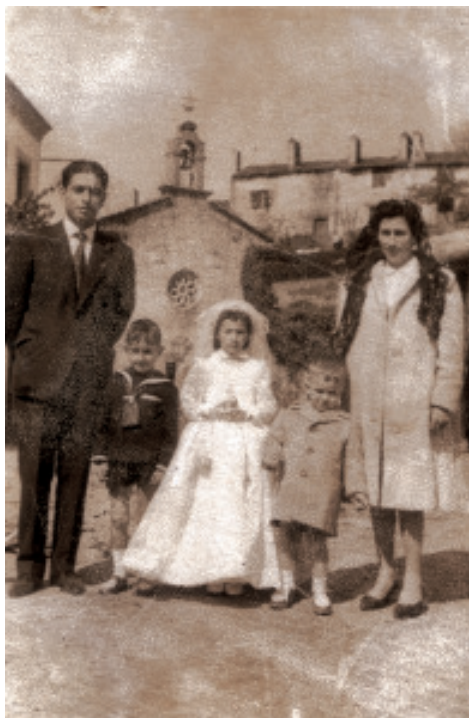
Fig. 4 Primeira comunión na capela, coas casetas (v. antigas chemineas).

Polo tanto, partiremos dun punto inicial que serán as fotografías panorámicas de Martínez Santiso (Vid. Fig. 3), onde poderemos ver como boa parte da explanada que hoxe ocupa a Avenida da Coruña quedaba reducida a un camiño de «quinientas y çinquenta baras de medir de tres pies cada bara» (Núñez Varela, Ribadulla Porta, 1984: 290). Esa era a distancia que nos separaba da vila amurallada.