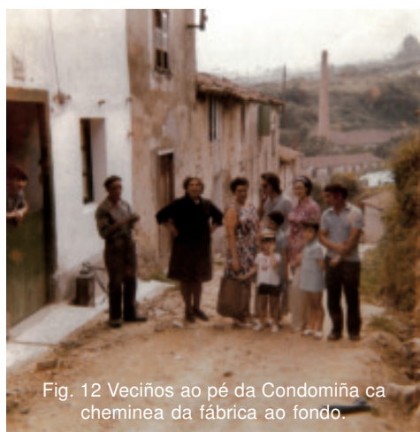
Fig. 12 Veciños ao pé da Condomiña ca cheminea da fábrica ao fondo.