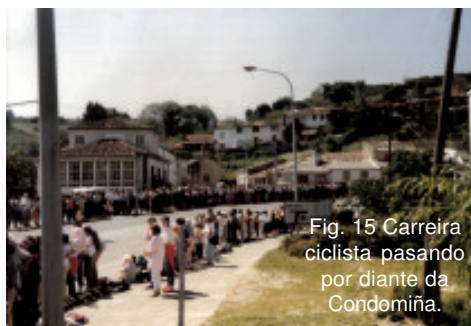
Fig. 15 Carreira ciclista pasando por diante da Condomiña.