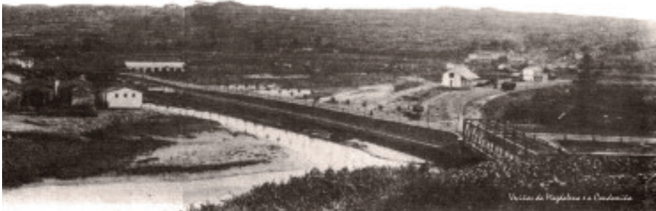
Fig. 24 Ponte do ferrocarril e o seu novo trazado pola Magdalena en 1913.