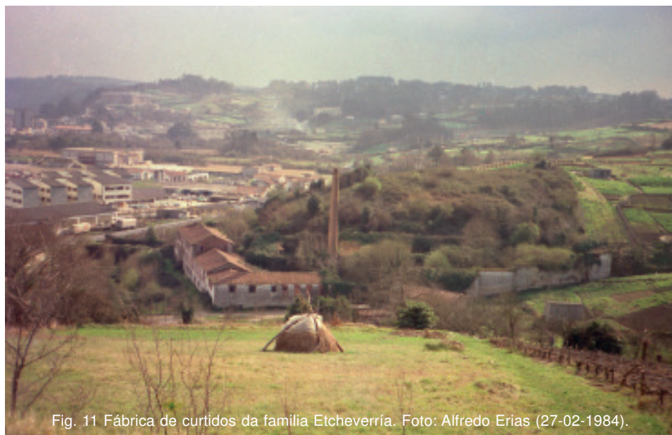
Fig. 11 Fábrica de curtidos da familia Etcheverría.