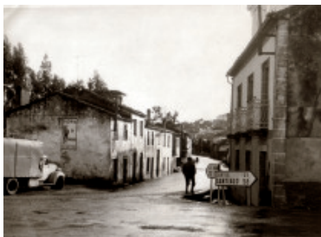
Fig. 48 Imaxe do cruzamento da Magdalena e da Avenida da Coruña