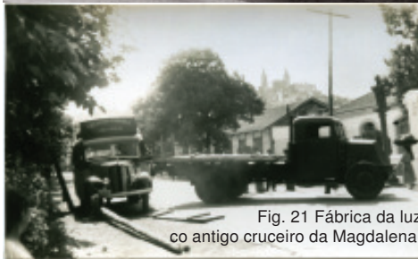
Fig. 21 Fábrica da luz co antigo cruceiro da Magdalena.