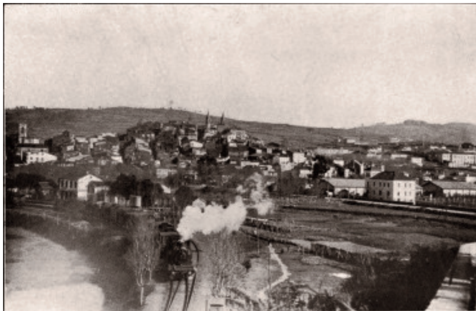
Fig. 27 Tren saíndo da estación de Betanzos-Cidade ca casa da Rega ao fondo. Vida Gallega , 20 de febreiro de 1935.