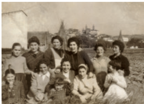
Fig. 47 Veciñas da Magdalena con Betanzos e os varais do lúpulo ao fondo.