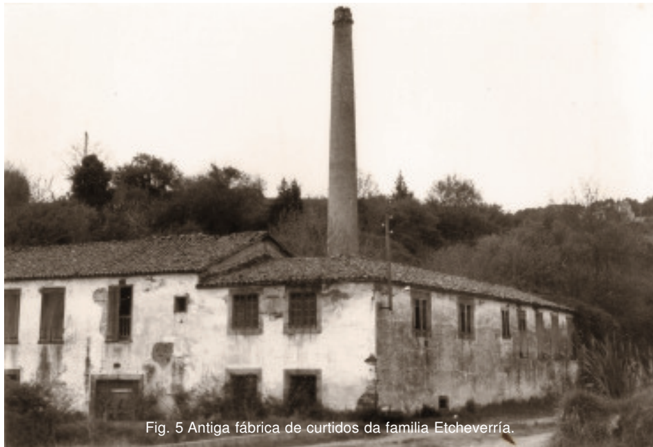
Fig. 5 Antiga fábrica de curtidos da familia Etcheverría.