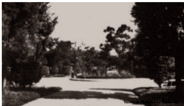
Fig. 32 Unha das primeiras imaxes do Parque Municipal.