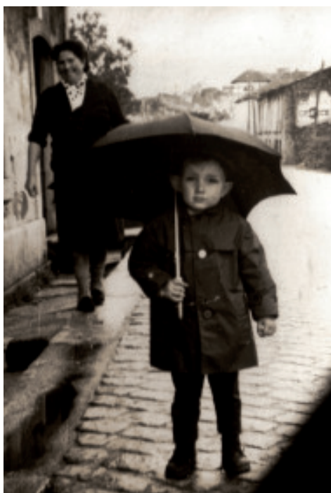
Fig. 56 Neno con paraugas diante das casas da Magdalena, coa Casa da Rega ao fondo.