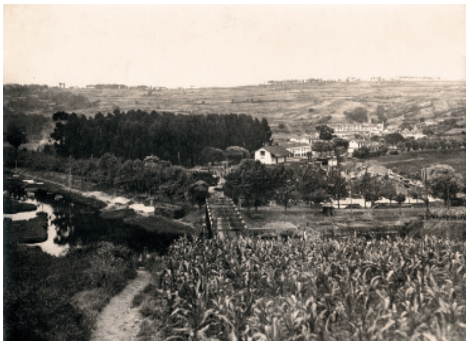
Fig. 28 Panorámica do barrio coa nova ponte do ferrocarril.