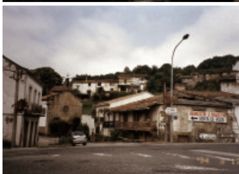
Fig. 17 Panorámica da Condomiña a finais dos anos 90 cos carteis das novas urbanizacións.