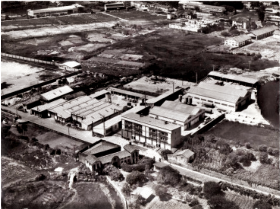
Fig. 42 Imaxe aérea do Carregal onde se ve a parte traseira da Casa da Rega e o barrio da Magdalena.