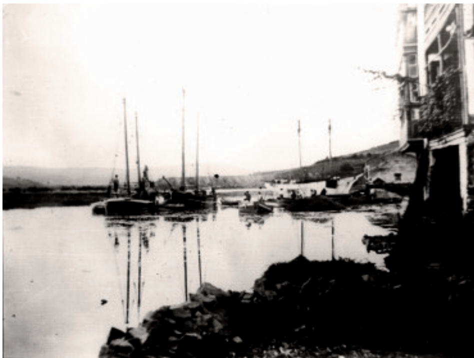
Fig. 26 Antigo peirao desaparecido ca chegada do ferrocarril.