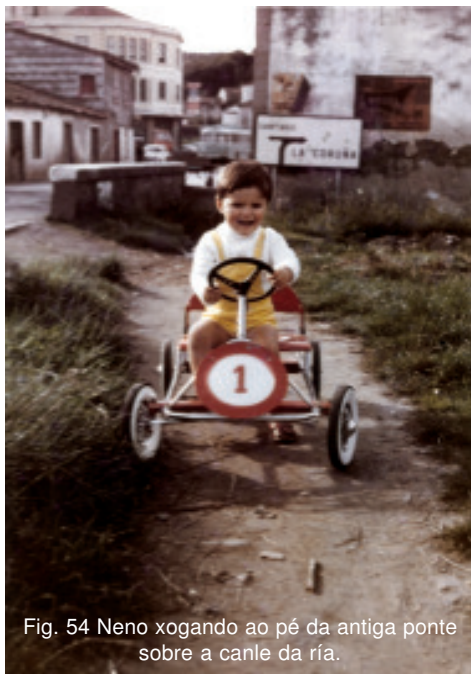
Fig. 54 Neno xogando ao pé da antiga ponte sobre a canle da ría.