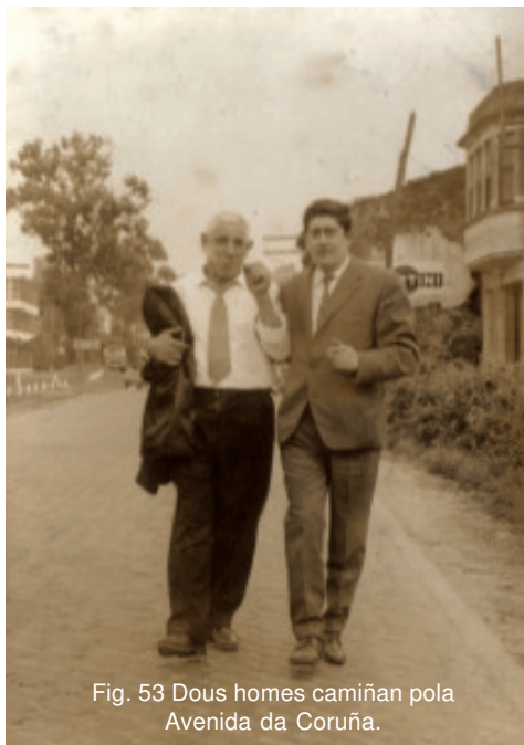
Fig. 53 Dous homes camiñan pola Avenida da Coruña.