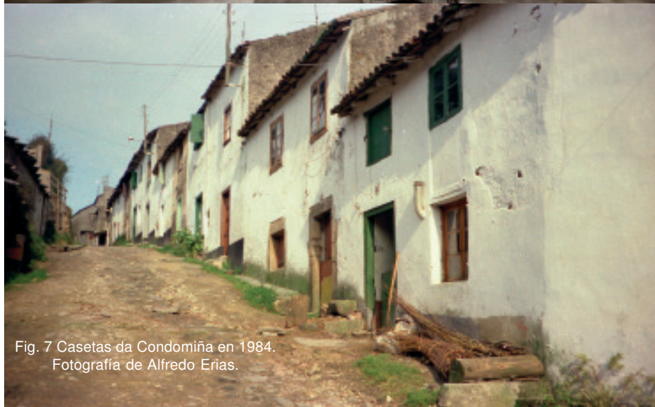
Fig. 7 Casetas da Condomiña en 1984.