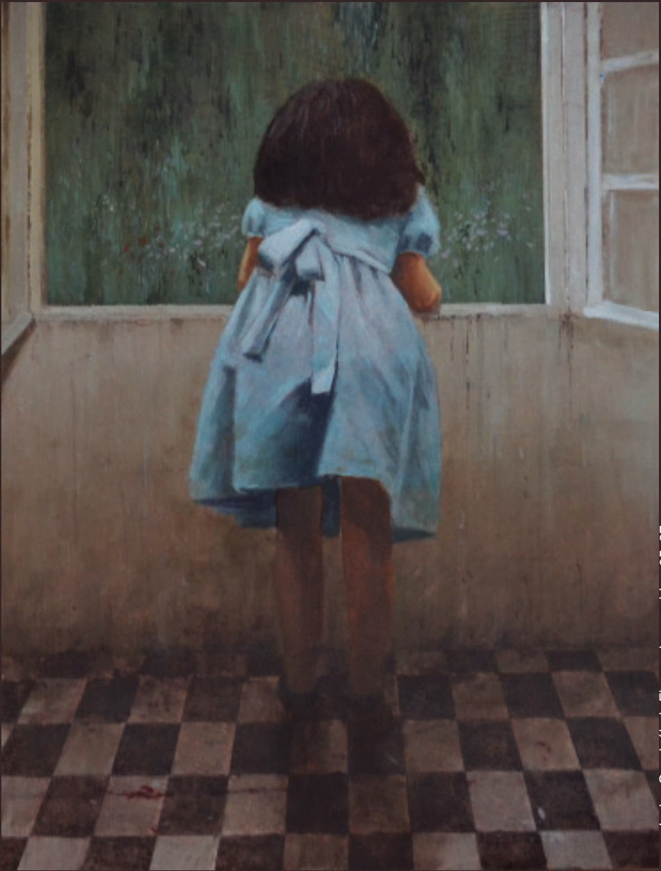
Javier Garaizábal. Figura de espaldas 35x27 cm

ESTE ANUARIO BRIGANTINO 2018, N. 41 REMATOUSE DE IMPRENTAR NO PRELO DE LUGAMI EN BETANZOS O 25 DE XULLO DE 2019 en pleno 800 aniversario do traslado de Betanzos ó Castro de Unta