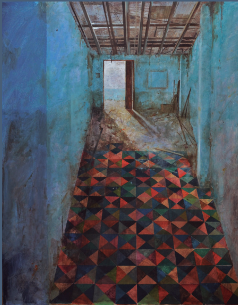
Javier Garaizábal. Suelo hidráulico 100x81 cm