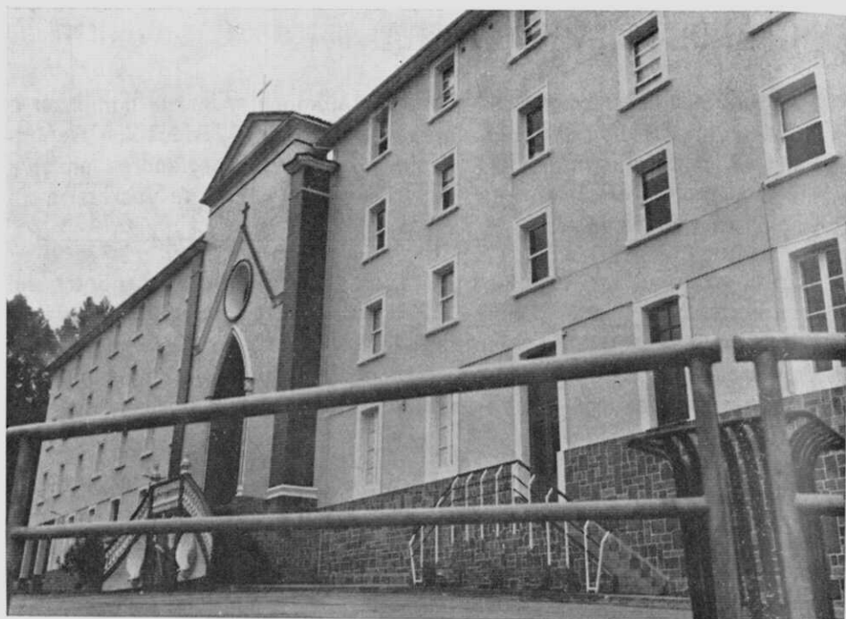
Fundación de los hermanos García Naveira, el Refugio—así se le sigue conociendo—ha renovado, con sus instalaciones, sus servicios educativos.