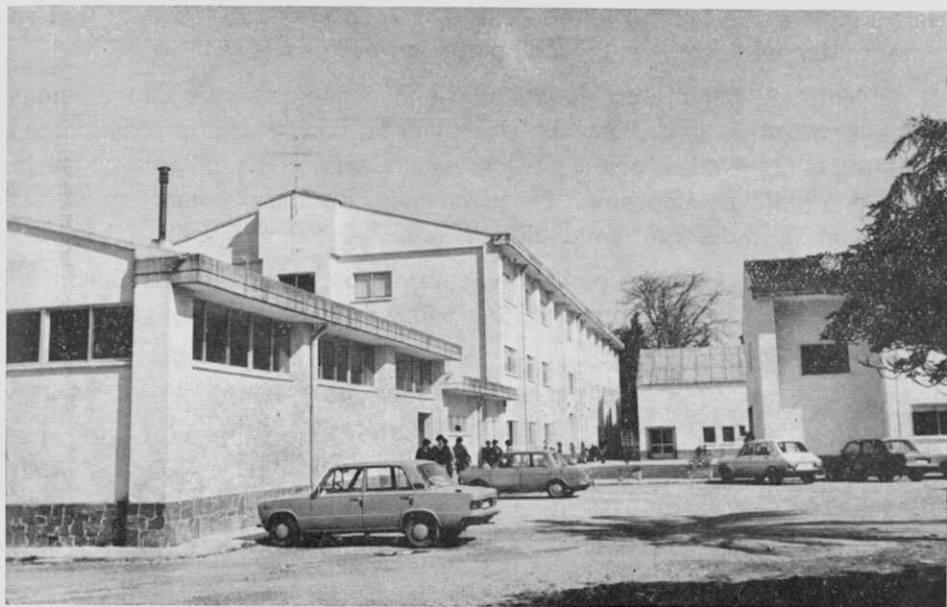
En el verano de 1978 la betancera Formación Profesional estrena su nueva sede.

En el curso 1979-80 se expiden los primeros títulos de técnicos especialistas en este Instituto betancero. En cuanto a la colocación de los alumnos en el plano laboral, no puede sustraerse Betanzos y su partido judicial, de donde proceden éstos, a la crisis económica, por tanto, y más de lo debido, se hace dificultosa la colocación de los titulados. Y dígase lo mismo, claro, de los que sólo obtienen el título de técnicos auxiliares.