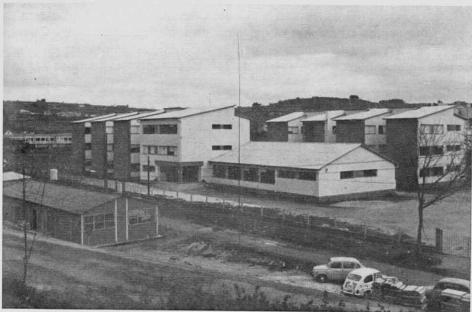
Chavales procedentes de los municipios de Betanzos, Paderne y Coirós reciben aquí educación básica.