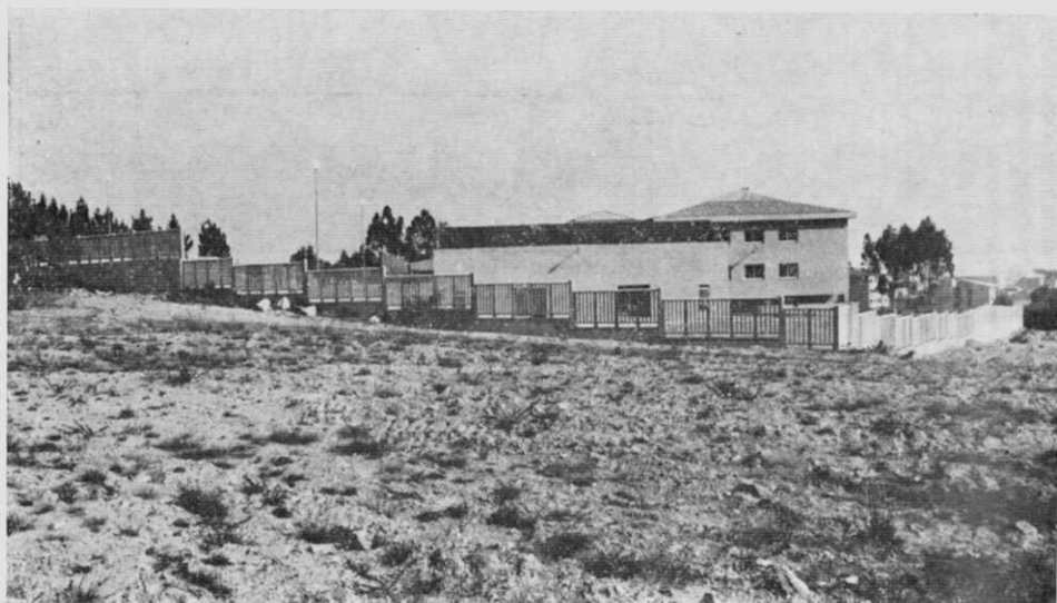
La Formación Profesional, en Curtis, empieza en modernas instalaciones.

Sirve este centro al alumnado vecino de los municipios de Curtis, Vilasantar, Mesía, Frades, Boimorto, Sobrado y de parte de los de Mellid, Cesusras y Aranga.