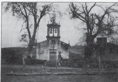
Capela de San Paio de Vilacova.

De Vilacova ás galerías mineiras do monte do Tintín vaise polo fondo “camiño de covas” e alí, dominando todo, está o Castro Maior. A función deste castro como ponto de dominio militar dos romanos explotadores de minas e de indíxenas é unha hipótese que merece terse en conta.