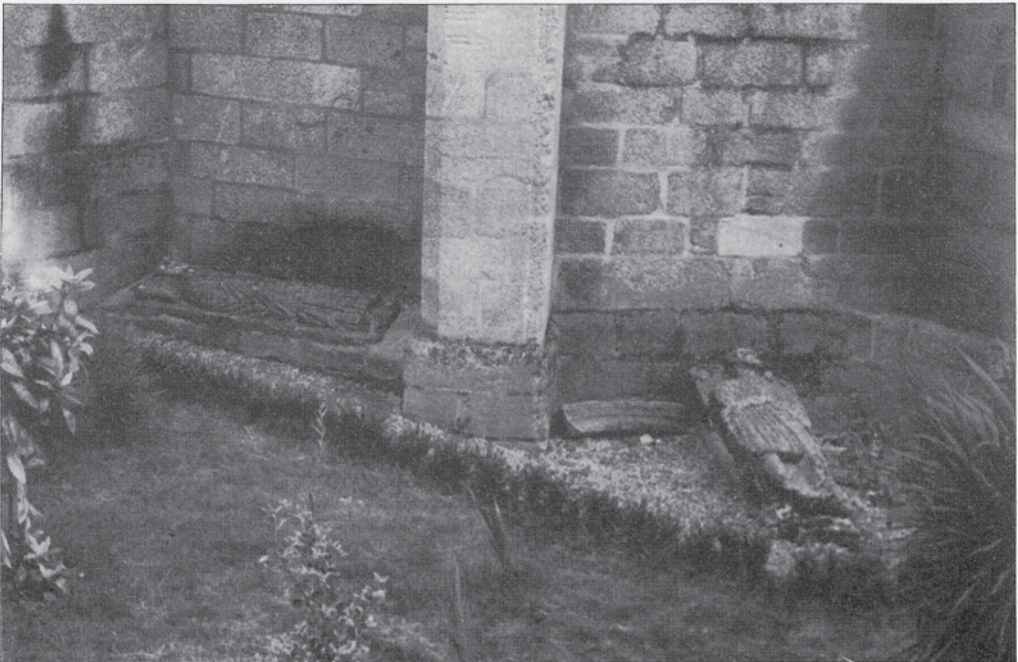
Parte exterior do ábside da eirexa de Santa María do Azogue cos sepulcros pegados.

E preciso que este sepulcro se coloque na eirexa de Santa María sin perda de tempo e os outros dous na mesma eirexa ou no Museo das Mariñas, pero en calquer caso hai que sacalos da situación de deterioro e de indignidade na que se atopan.