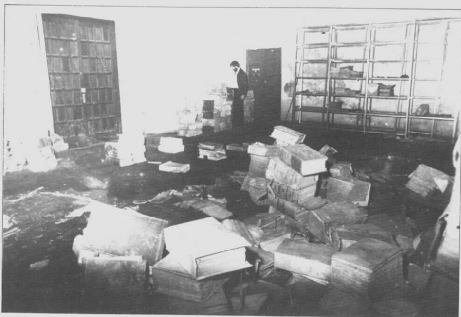
Estado no que se atopaba o Arquivo Notarial nunha dependencia do antigo convento de Santo Domingo. VII-1983.