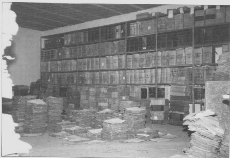
Mentres no chao se van aillando as series, ó fondo xa se atopa boa parte do Arquivo Notarial organizado. Edificio da «Cárcel», 4-I-1984.