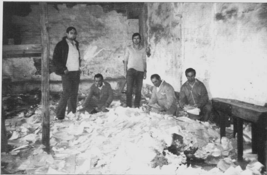
Traballadores do Arquivo e dos Servicos Municipais facendo fardos de documentos para transportalos mellor.

de 1976) debido ás obras que se estaban levando a cabo no edificio do Concello. Resulta inexplicable que unha vez que a Administración subiu outra vez para o Concello, a documentación quedase no antigo Hospital sen ningún tipo de coidado e abandonada. Non é extraño, polo tanto, que se queimasen documentos, se roubasen, etc.