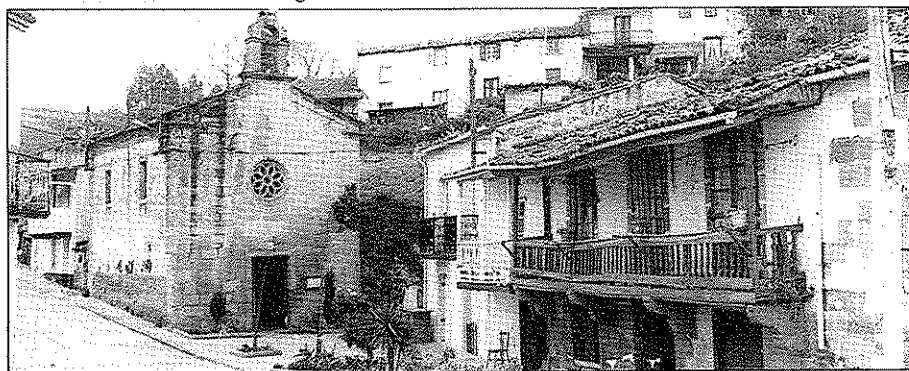
Figura n.º 6