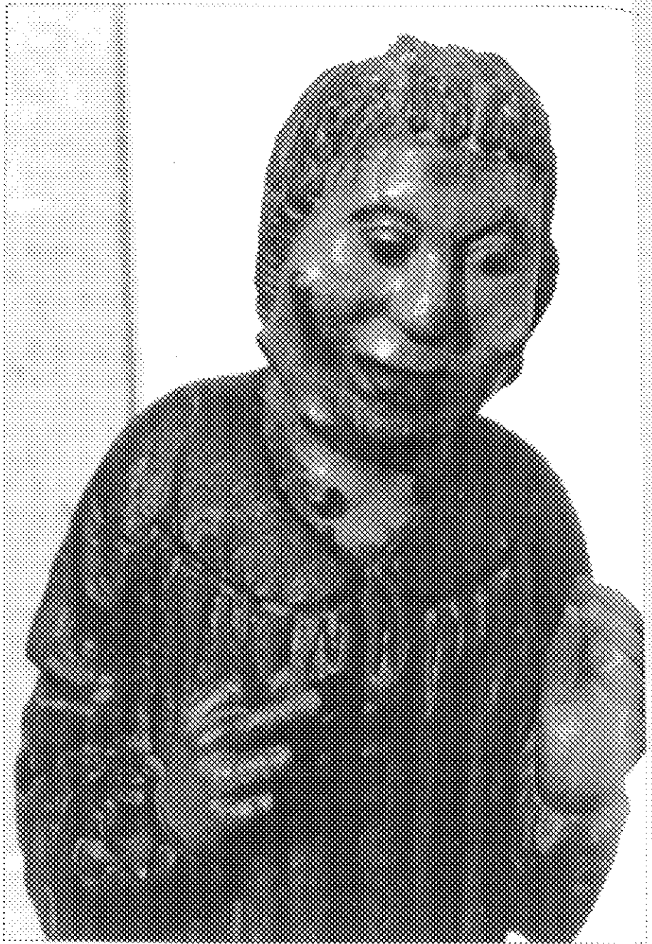
Figura 2. 12

P roblemas de comportamiento que dan lugar a conductas No relacionadas con el nivel de inteligencia