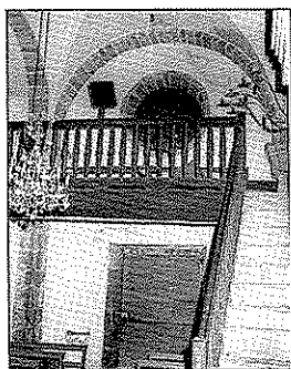
Figura n.º 5