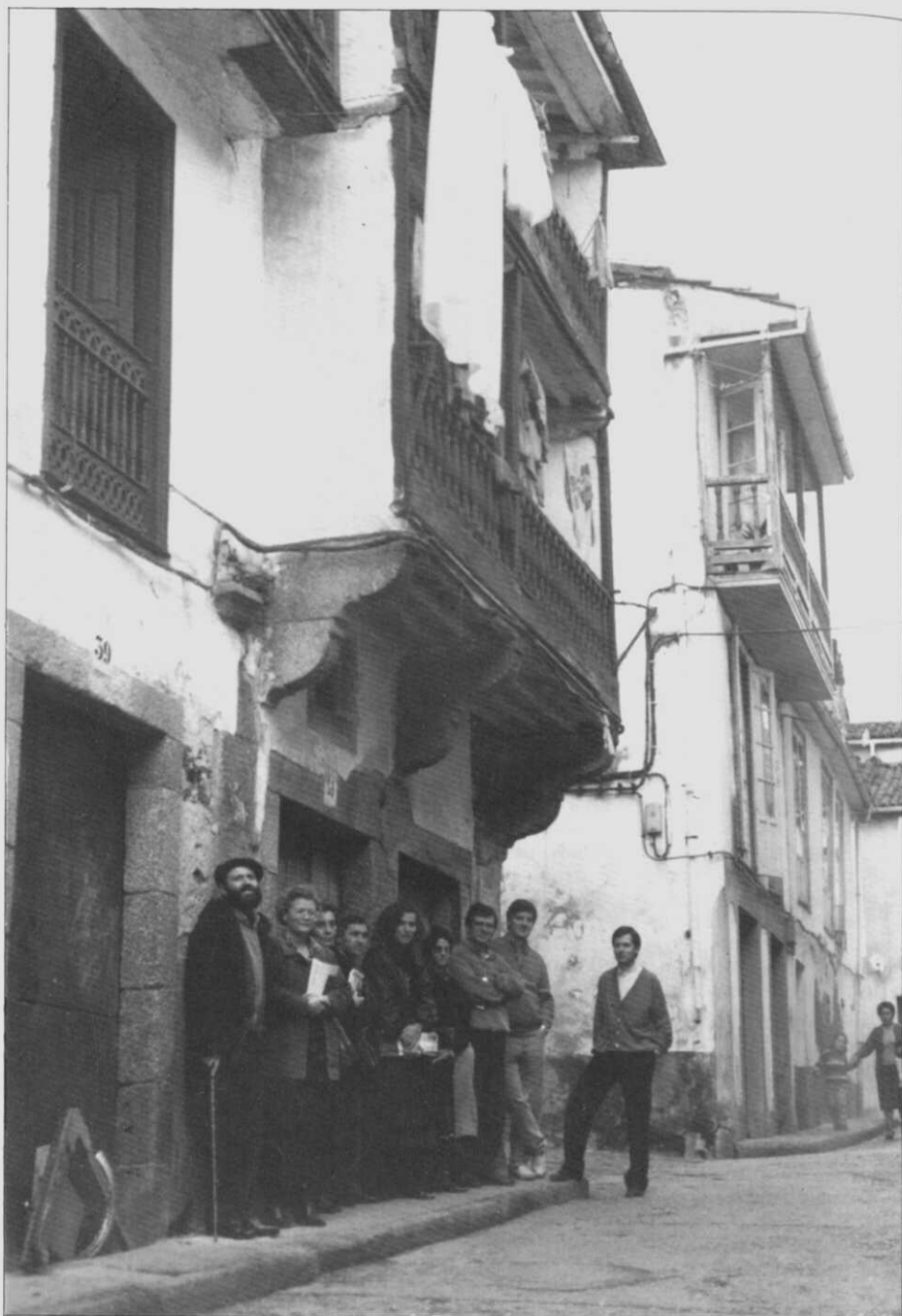
Os participantes nas «Primeiras Xornadas de Museos Comarcais de Galicia» polas rúas de Betanzos