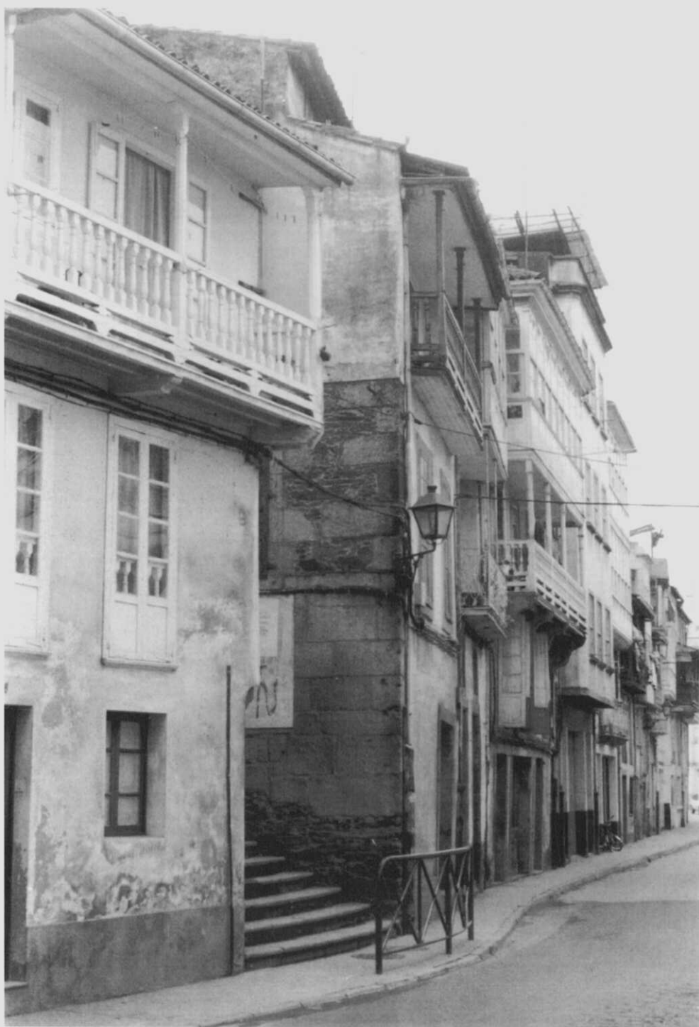
Rúa da Ribeira. Fotografía de Alfredo Erias (X-1991).