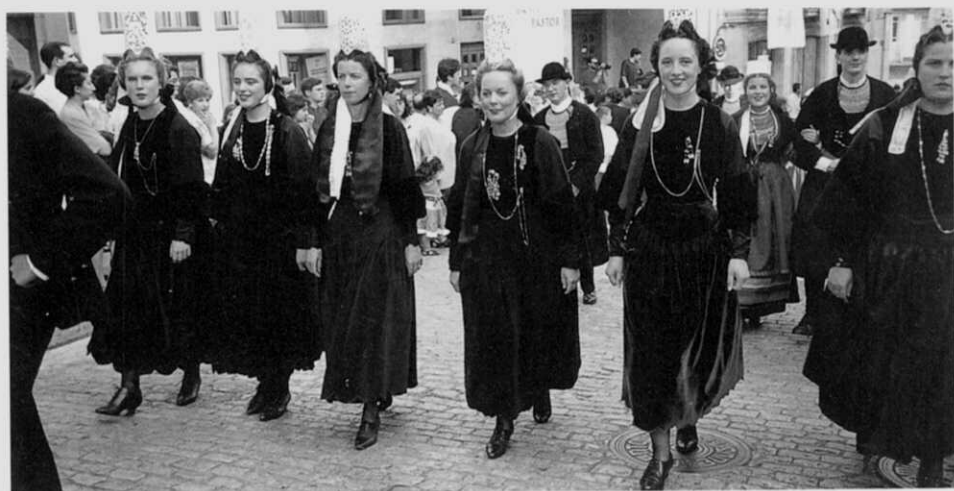
A cidade irmán de Pont L'Abbé, da Bretaña francesa, participou nos desfiles festivos cunha fermosísima mostra dos seus traxes tradicionais.

anhelante, unha antena prodixiosa. Os adultos, co seu tesón e brío, faránnos saber que a pesar de tódolos pesares a loita e a esperanza son aínda posibles. Os vellos deixarán que escoitemos a súa voz que ven de tan lonxe desatando encrucilladas e filtrando no seu corazón o amor á terra e ó seu zumo de ledicia, e que é preciso sementar por enriba do oído.