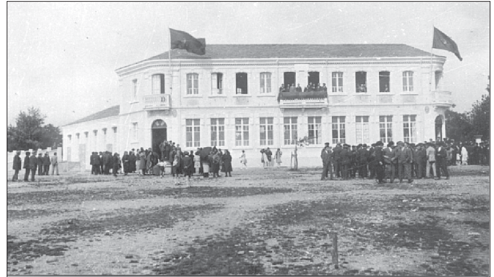
Fig. 1.- Inauguración da escola das Pontes no 1928.

Un dos elementos fundamentais para comprender o complexo proceso de asimilación ou integración das colectividades de inmigrantes españolas nas sociedades receptoras, é o estudo do asociacionismo de carácter étnico que se vai desenvolver nos países americanos dende mediados do século XIX; e que no caso concreto de Cuba vai adquirir unha gran importancia, pervivindo aínda na actualidade.