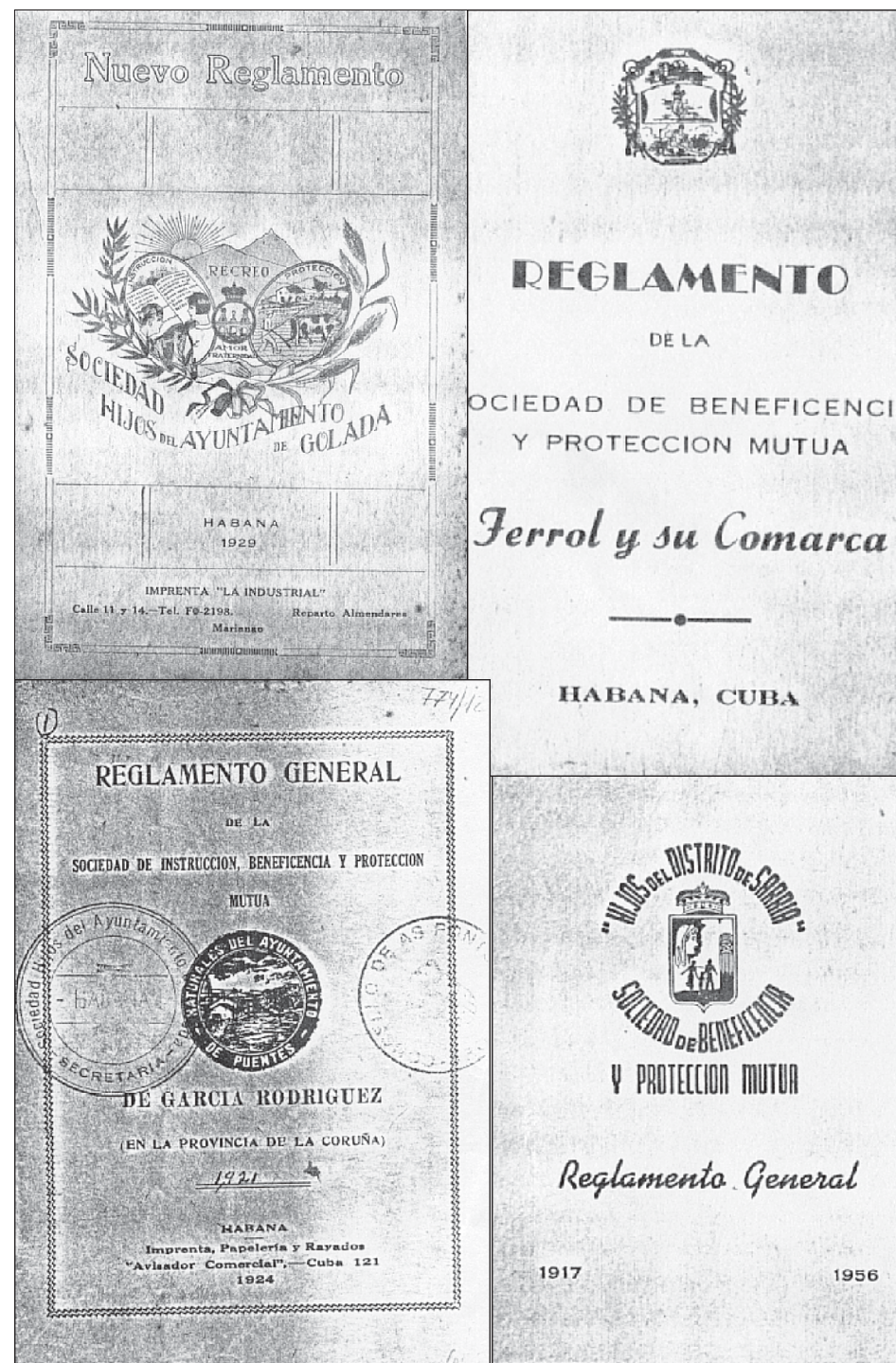
Fig. 4.- Regulamentos dalgunhas sociedades galegas en Cuba.