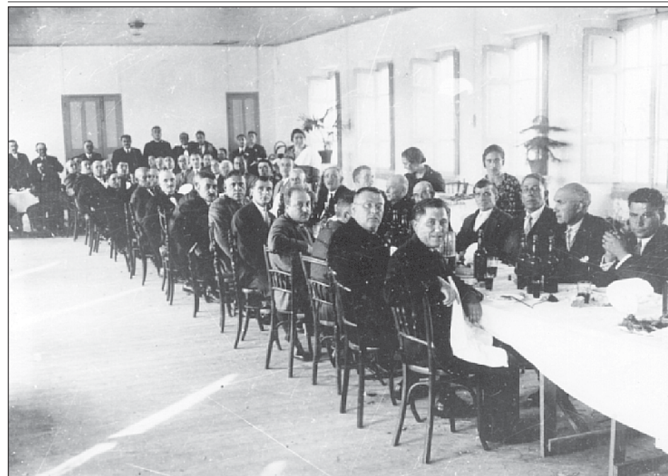
Fig. 2.- Banquete de inauguración da escola das Pontes no 1928.

Moitos destes emigrantes seguen mantendo unha forte vinculación co país de procedencia, por considerar que a súa estadía nos países americanos non sería definitiva, pois nos primeiros anos pensaban na posibilidade dun próximo retorno, e, ademais, o carácter de emigración familiar implicaba continuas relacións cos parentes asentados na Península.