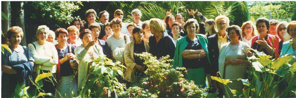
Anuario Brigantino 1998, nº 21

Como se puede ver, y sobre todo oír, el proyecto que se inició en 1990 de la mano de la Concejalía de Cultura de nuestro Ayuntamiento está funcionando a la perfección, y es de esperar que en un futuro no muy lejano, la calidad musical de nuestra Banda haga que dentro de las bandas populares lleguemos a ser una de las mejores de nuestro país.