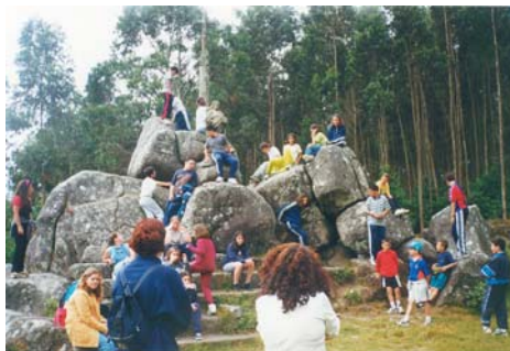
Anuario Brigantino 1998, nº 21