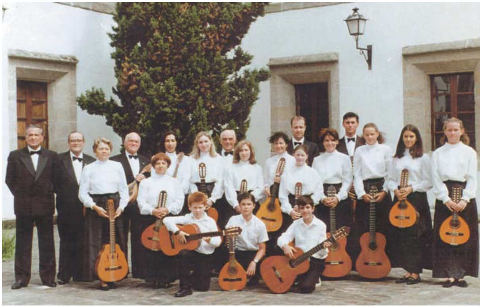
Agrupación Musical "Carlos Seijo".