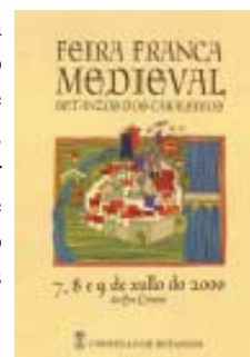
Anuario Brigantino 2000, nº 23