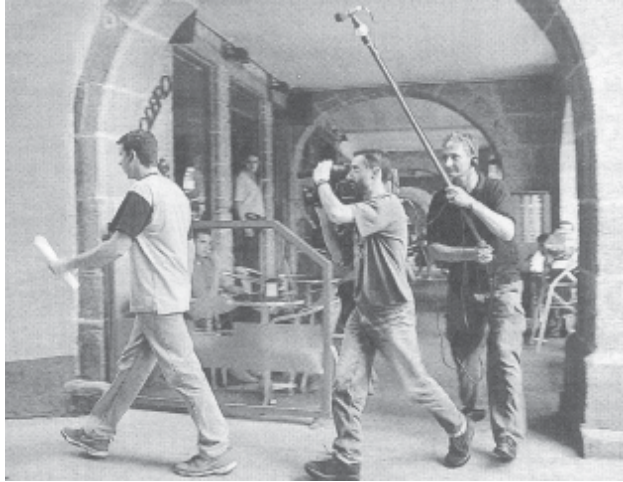
La Voz de Galicia: Estudios Blanco

Ó longo destes días veuse celebrando o Ciclo de Música do Concello de Betanzos Verán 2000, organizado pola Delegación de Cultura e Deportes do Concello, que se desenrolou no Claustro do Museo das Mariñas e na igrexa de San Francisco. Participaron os grupos: Orquestra de Cámara Vox Aurae de Brescia, Cuarteto de Saxofóns da Coruña, Artabria Trium, Muxicas, Dúo Arabesco, Trío Untia, Agrupación Musical Carlos Seijo, Coral Polifónica de Betanzos e Banda Municipal de Música.