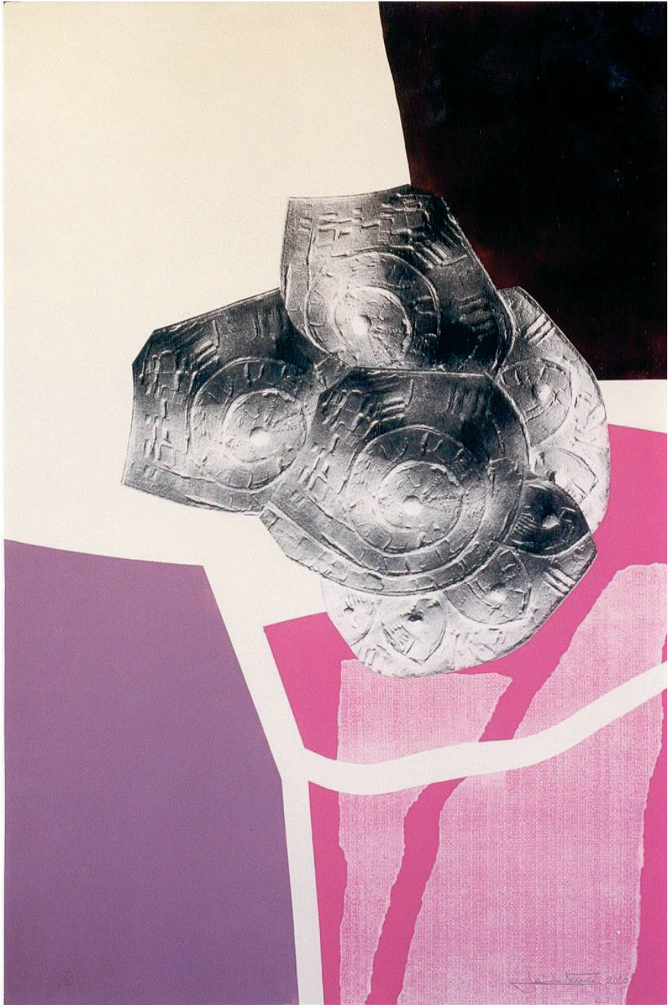
Jesús Núñez. Litografía-electrografía. 113x73,5 cm.