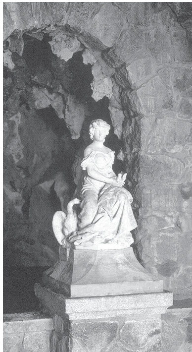
Fig.3 -La joven Leda y Zeus. Alegoría pagana del misterio de la Inmaculada Concepción. A Quinta da Regaleira.