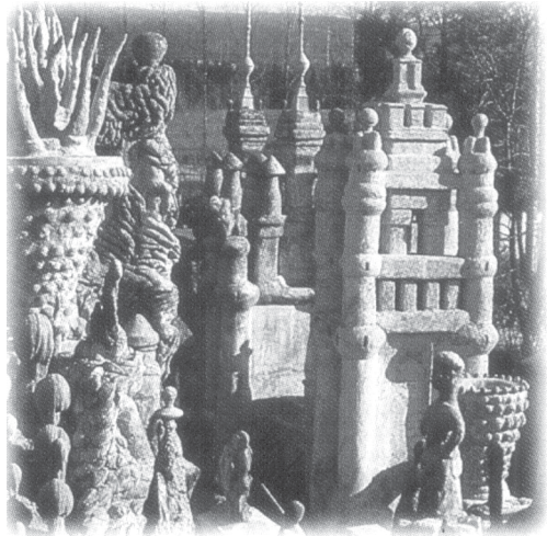
Fig.5 -Le Palais Ideal du Facteur Cheval. Hauterives. Francia.

Destacan el mirador chinesco de El Pasatiempo (v.fig.4), parejo al mirador de Braga ( Portugal). Situado en el segundo nivel y rodeado de vegetación arbórea. Hoy desaparecido, pero cuyo testimonio en fotografías nos muestra el esmero en su construcción de tres plantas y en la construcción del tejado. Su utilización no está clara. No obstante, no cabe duda que más que diluirse en el conjunto era un elemento que deseaba despertar la curiosidad del visitante a la vez, que por su estilo, marcaba la diferencia estructural y arquitectónica que definía al conjunto del parque.