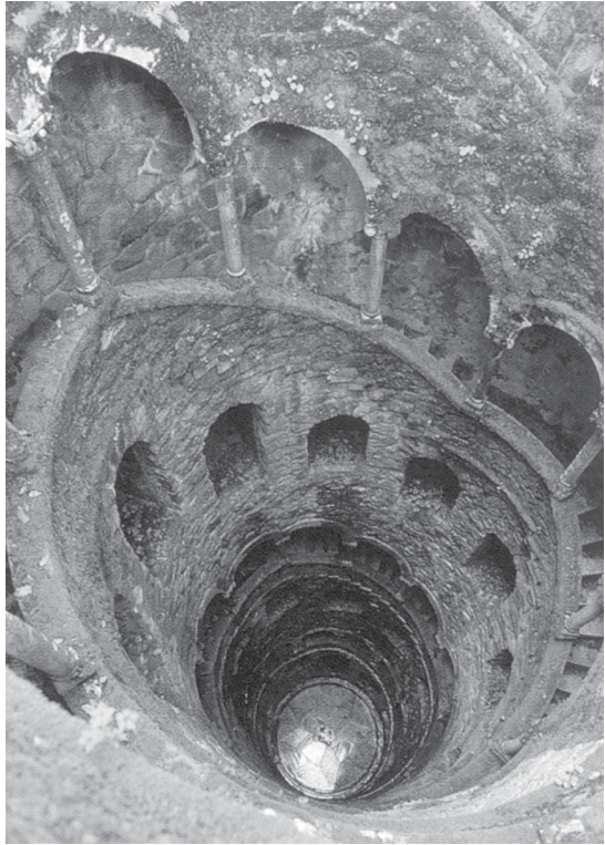
Fig.2 -Pozo o torre invertida en A Quinta da Regaleira.

Además de esos orígenes mitológicos y su asociación a cultos y creencias pre-cristianas. Lo que nos interesa es saber como, después de un impás de casi dos siglos y desde el siglo XVIII, hay un giro que hace renacer el aprecio por Sintra. La preferencia se puso de moda en un determinado estrato de la sociedad: el burgués, liberal y romántico. Tener casa en Sintra era una señal de fortuna, de buen gusto, de importancia política y social. Se convierte en villa estival predilecta de veraneo. Aparecen lujosos palacetes de capital extranjero, desde el cónsul holandés de Portugal Gerald de Visme, hasta el mismo Lord Byron. Desde el punto de vista arquitectónico, estas construcciones, revitalizarán estilos medievales (neo-manuelino y neo-gótico) y quiñetistas, y sobre todo aportan nuevas tendencias artísticas. Esto influyó en la decisión de Carvalho Monteiro en la elección de Sintra como lugar para su villa. Y también de ese movimiento artístico y gusto estético de la época del que participará y es un claro ejemplo A Quinta da Regaleira y su Palacio dos Milhões.