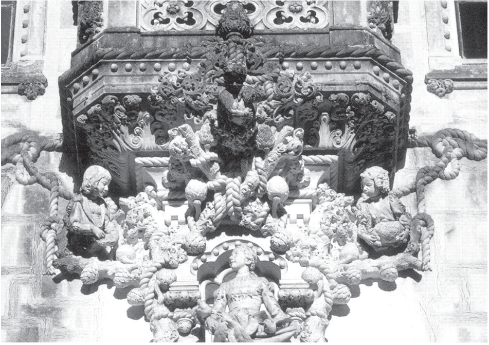
Fig.1 -Detalle del Palacio de Milhões en A Quinta da Regaleira.