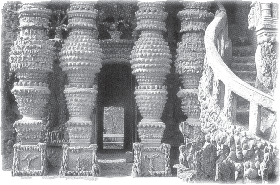
Fig.6 -Le Palais Ideal du Facteur Cheval. Hauterives. Francia.