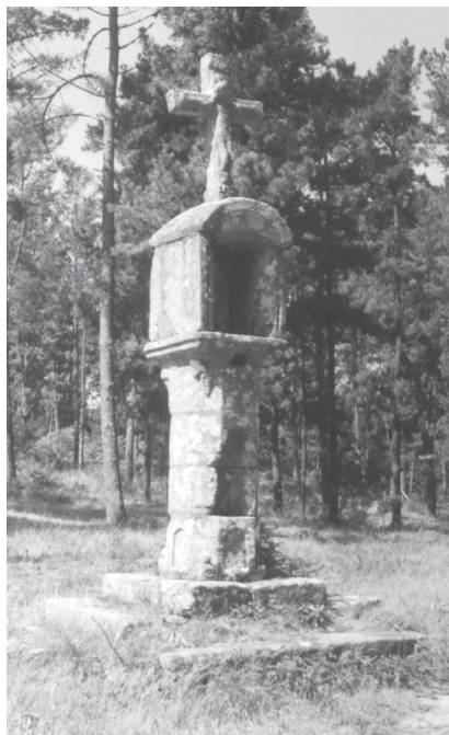
Lám. II: Cruceiro de Abelán ou Dabelán.

Agora no interior non acolle ningunha imaxe, pero os veciños contan que dicían os vellos que antes estaba unha da Virxe, que desapareceu xa hai moitos anos. Algúns din que é a que campa na fornela da fachada da igrexa parroquial, sobre a porta.