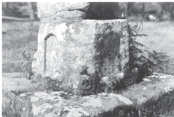
Lám. III: Cruceiro de Abelán: primeira pedra do fuste.

O monumento remata coa cruz, asentada no teito da capela, sobre unha pequena base cúbica con adorno nas catro caras en zigzag. É de sección cadrada, coas arestas rebaixadas, agás nos remates dos brazos que son cadrados, tendo no medio de cada un dos cantos un círculo inscrito.