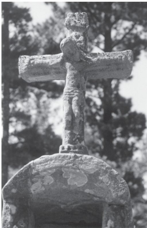
Lám. V: Cruceiro de Abelán: capela e cruz.

No fuste ten unha longa inscrición, incompleta dende que abriron a fornela, desaparecendo parte das letras frontais da segunda pedra. Está clara a data, 1672, que debe corresponder á de construción. Aínda que é posible ler algunhas palabras, en conxunto é ilexible por acharse moi esvaídas, ter desaparecido varias, e tamén polas moitas abreviaturas de difícil interpretación 4 .