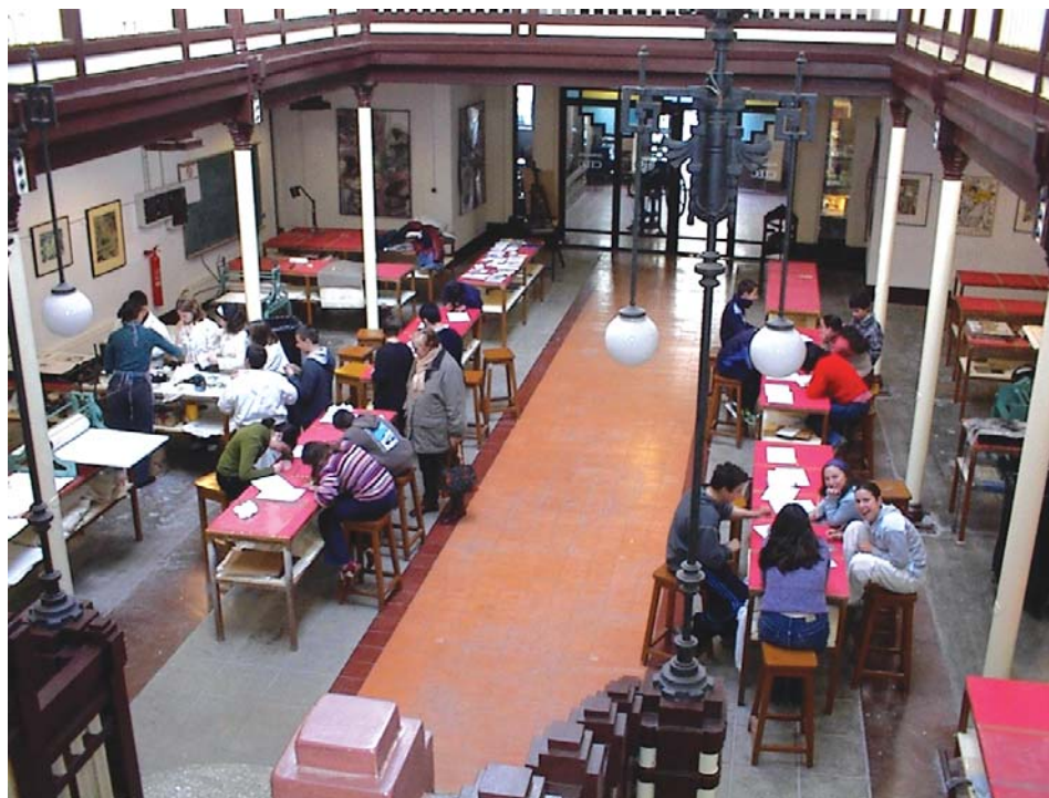
Visita didáctica al CIEC.

Fundación CIEC Centro Internacional de la Estampa Contemporánea Rúa do Castro, 2 15.300 Betanzos. Tel. 981 772 964 Fax.981 774 367 ciec@fundacionciec.com