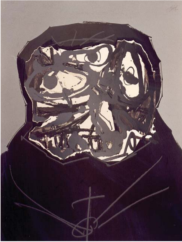
Saura. Aphorismen. Serigrafía, 70x50 cm.