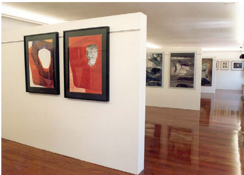
MUSEO DE LA ESTAMPA CONTEMPORÁNEA: SALA JESÚS NÚÑEZ.