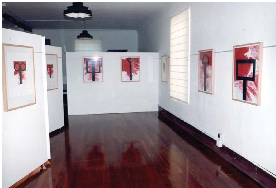
Exposición temporal de Luís Feito.

grupo de profesores vinculados al CIEC, participaron en dicho foro más de 100 profesores. Otra de las colaboraciones que el Centro viene prestando desde hace varios años, es el hecho de formar parte del jurado del Premio de Grabado Máximo Ramos de Ferrol, en el que concede dos accésits consistentes en becas de estancia y trabajo en sus talleres.