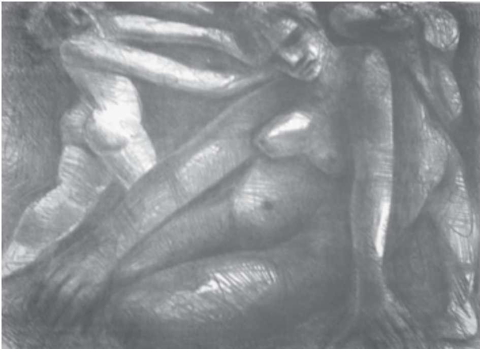
Álvaro Vila. S/T. Litografía. 41,5x31 cm. 2002.