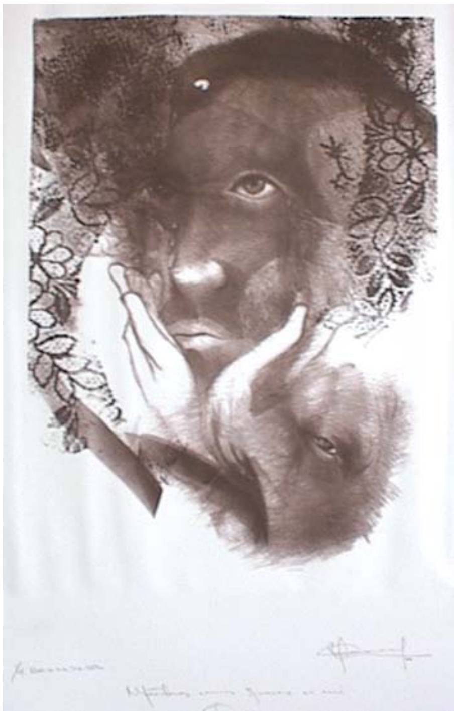
Omar Kessel. Mientras más quiero a mi perro . Litografía. 39,5x 28,5 cm. 2002.