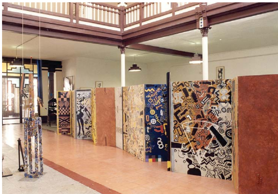
«Muros». Instalación de Luis Guerrero.