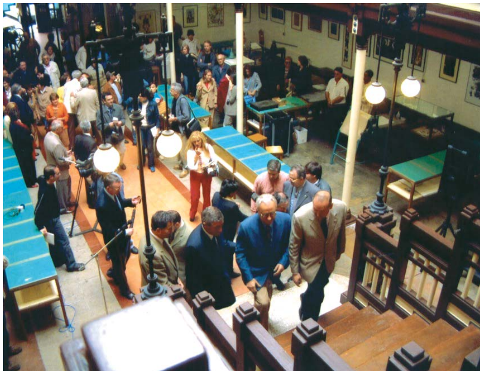
Inauguración del MUSEO DE LA ESTAMPA CONTEMPORÁNEA (27-VI-2002).

visto culminado con la inauguración del mismo en el mes de junio, a la que asistieron numerosas personalidades del mundo de la cultura, así como representantes de las instituciones y entidades que patrocinan la Fundación CIEC. Este hecho ha convertido al Centro en un Museo vivo, ya que además de la exposición de la obra gráfica, los visitantes pueden contemplar los distintos talleres situados en su planta baja, donde trabajan los artistas y se imparten los cursos.