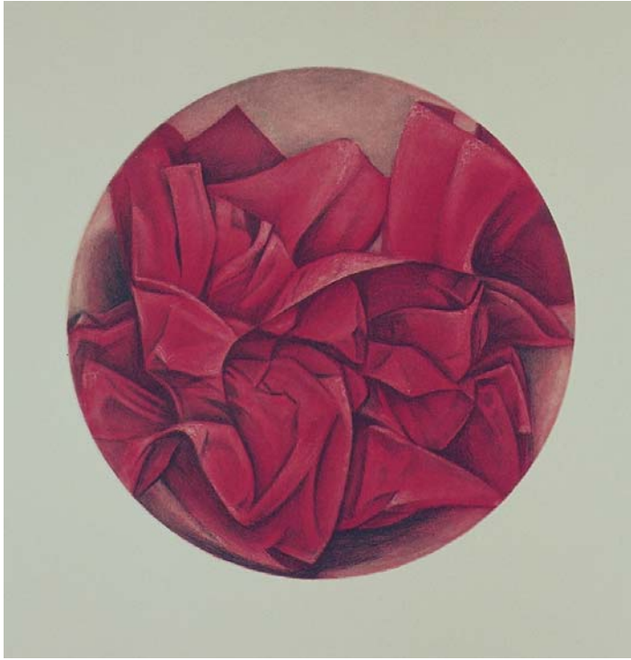
Anne Heyvaert. S/T. Aguafuerte / aguatininta. Diam. 40 cm. 2002.