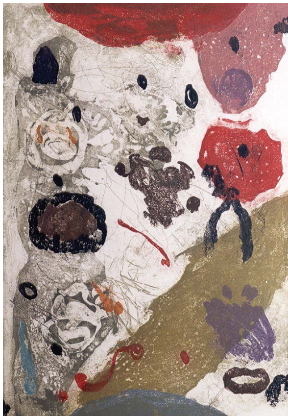
Jaffar Kaki. Sonata. Aguafuerte/ aguatinta al azúcar. 76x56 cm.