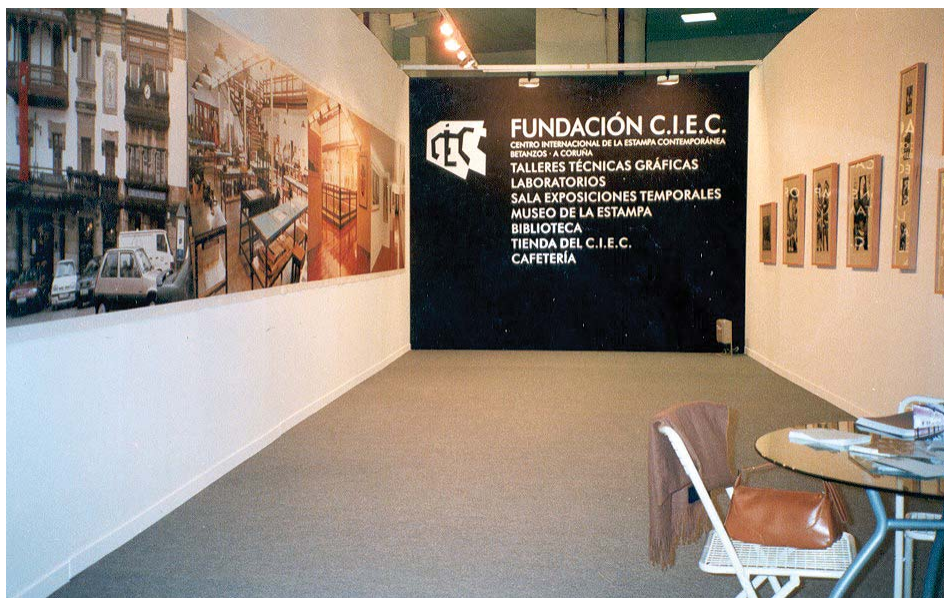
Stand del CIEC en el X Salón Estampa (Madrid, 2002).

Talleres y Cursos anuales. El CIEC, como viene haciendo desde su creación, y con el ánimo de ser un Museo Vivo, mantiene sus talleres abiertos a lo largo de todo el curso con el fin de favorecer a los artistas un taller con todas las instalaciones, maquinaria y materiales necesarios para llevar a cabo la creación de estampas.