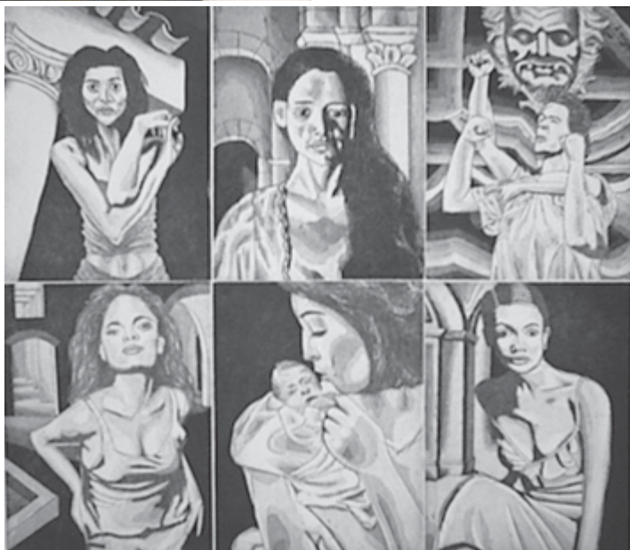
Javier Cordero. En el laberinto de las pasiones. Aguafuerte/aguatinta. 32,5x37 cm. 2002.