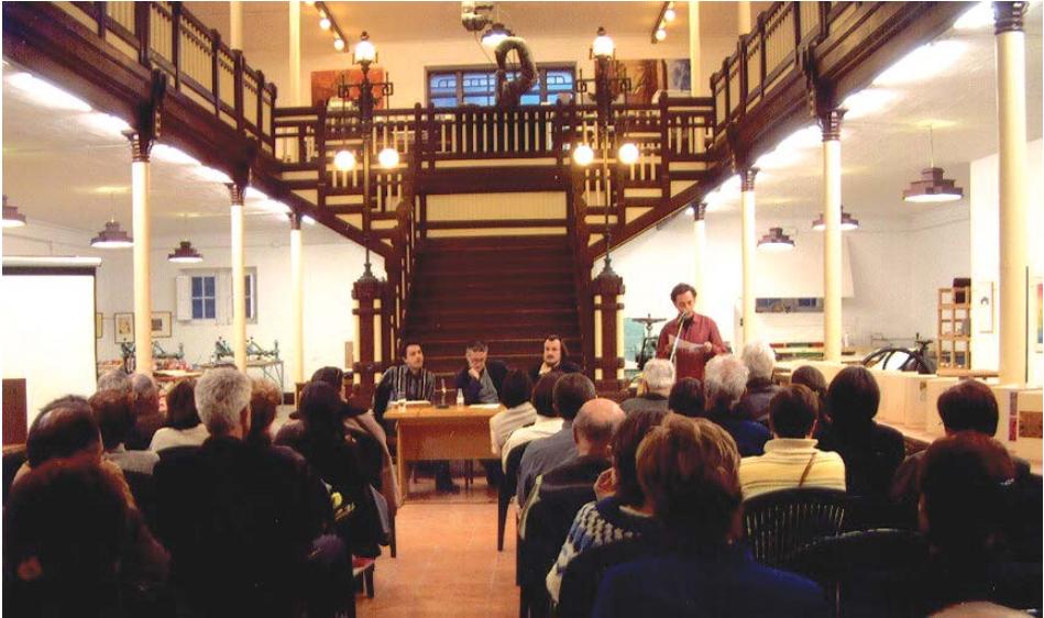
Jornadas sobre Gráfica y Poesía.