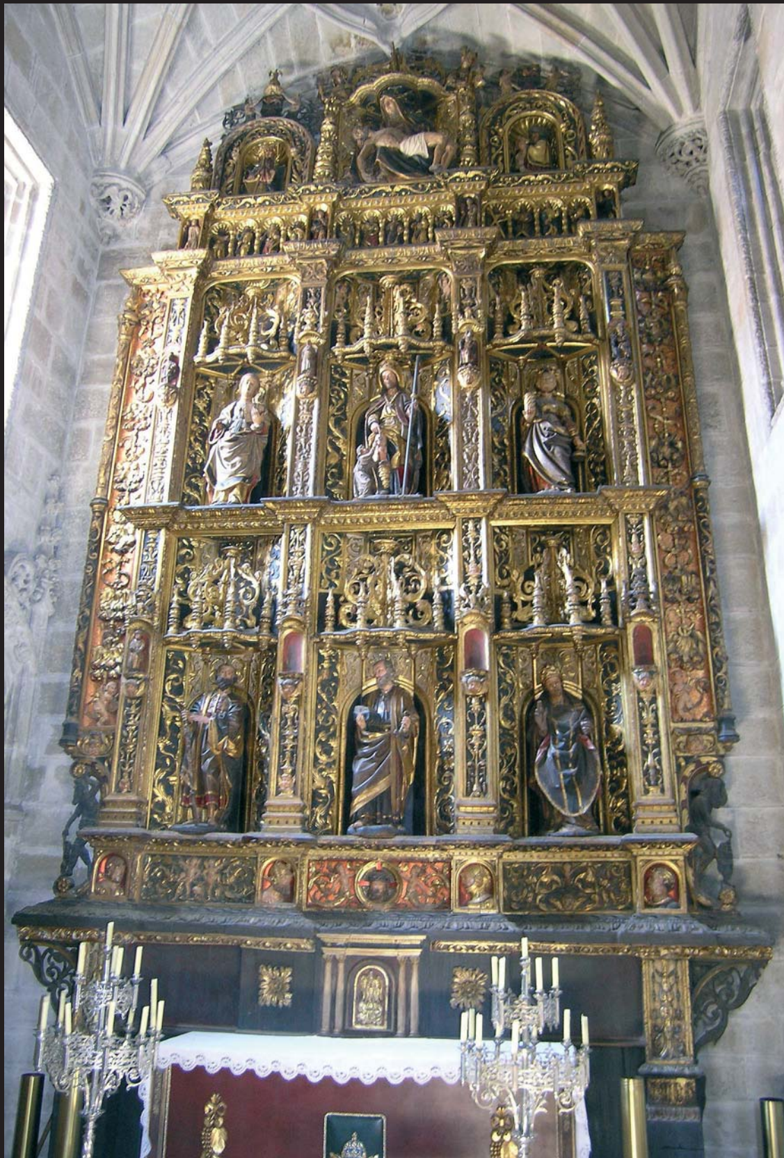
Retablo do Arcebispo Pedro de Ben (ca. 1525), obra de Cornelius de Holanda, Igrexa de Santiago, de Betanzos.