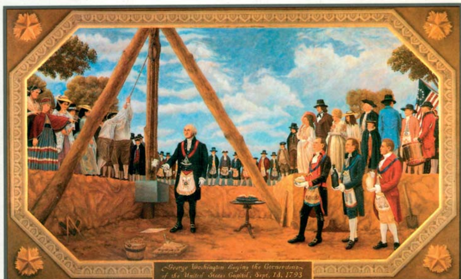
George Washington colocando la primera piedra del edificio del Capitolio de Estados Unidos, como Gran Maestro. Washington fue uno de los primeros héroes románticos que se ciñeron al constructo «militar, liberal y masón».