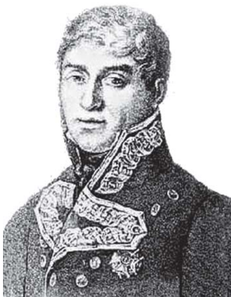
El general Luis Lacy.