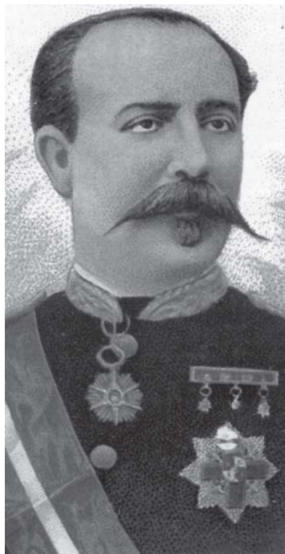
El betanceiro general Villacampa.

En España este mito complotista gozará de una enorme difusión siendo fomentado y extendido, desde muy pronto, por los medios inquisitoriales y eclesiásticos en general. Obras originales de sacerdotes como Lorenzo Hervás y Panduro y Simón López, o traducciones del celeberrimo libro de Barruel Memoirs pour servir à l'Histoire du jacobinisme -que gozará de la friolera de cinco ediciones en sólo dos años (1812-1814)-, serán las que consigan crear todo un auténtico y “moderno” estado de opinión en la minoría instruida -