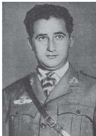
Ramón Franco Bahamonde.