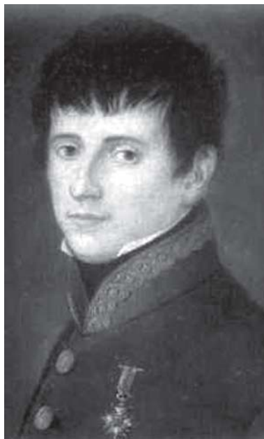
El general Luis Riego.

Su propia estructura mental cien por cien reaccionaria -profundamente católica y antiliberal-, sus íntimas veleidades o ensoñaciones aristocráticas en relación a su origen genealógico, su firme y convencida creencia de saberse un elegido de su dios para redimir, por medio de una “Santa Cruzada” a su “Patria”, su natural perfil introvertido, sobre todo a partir del cierre de la Academia Militar de Zaragoza, nos muestran a un sujeto psicológico excesivamente autocontrolado o reprimido que, sin llegar al extremo psicótico paranoide