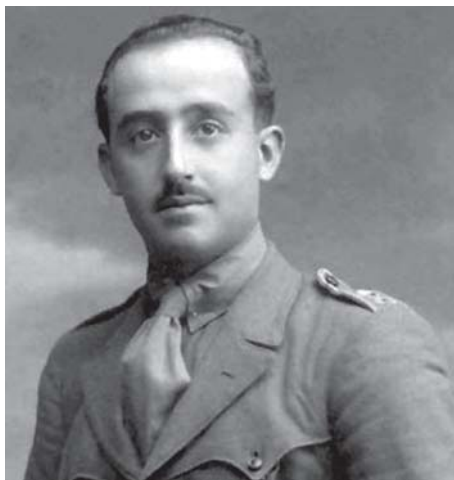
Francisco Franco Bahamonde.

El nuevo régimen salido de la Revolución setembrina de aquel decimonónico Sesenta y ocho, decretará muy pronto la libertad de asociación y, a su calor, y hasta los años del Desastre colonial, comprobaremos cómo fructificará por doquier -tanto en capitales de provincia como en infinidad de villas y pequeñas entidades de población- una enorme profusión de logias con un elevado número de miembros, mayoritariamente civiles aunque también con una nada pequeña porción del mundo militar que, por lo general, poseerá idearios progresistas o republicanos.