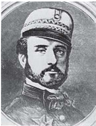
El general Prim.

La primera de las cuestiones o asuntos citados por Franco, el hecho de juzgar a la masonería como elemento subversor de la jerarquía militar, fue siempre un tema de discusión tertuliesco y periodístico muy manido en todo ambiente militar y político conservador y, es justo decirlo, posee obvias connotaciones de auténtico criticismo racional, siendo además este quebranto de la disciplina para la mentalidad militar de todos los tiempos, algo muy serio y peligroso, como también recordará el profesor Payne en su obra clásica sobre los militares y la política en España. 5