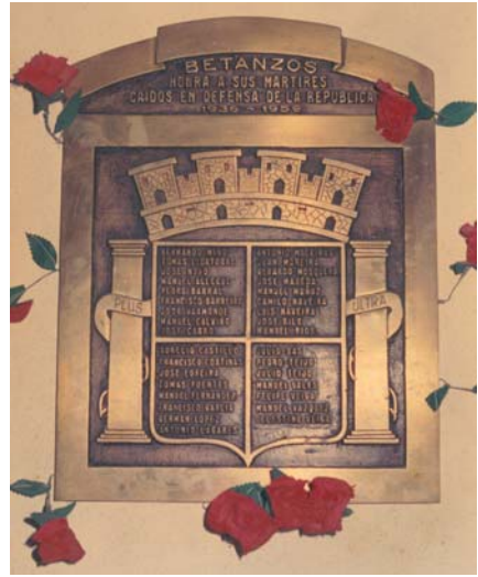
Praca homenaxe aos mártires betanceiros no Centro Betanzos de Bos Aires en 1959. Recentemente, a instancias da Asociación Cultural Eira Vella, colocouse unha réplica na entrada ao Museo das Mariñas.