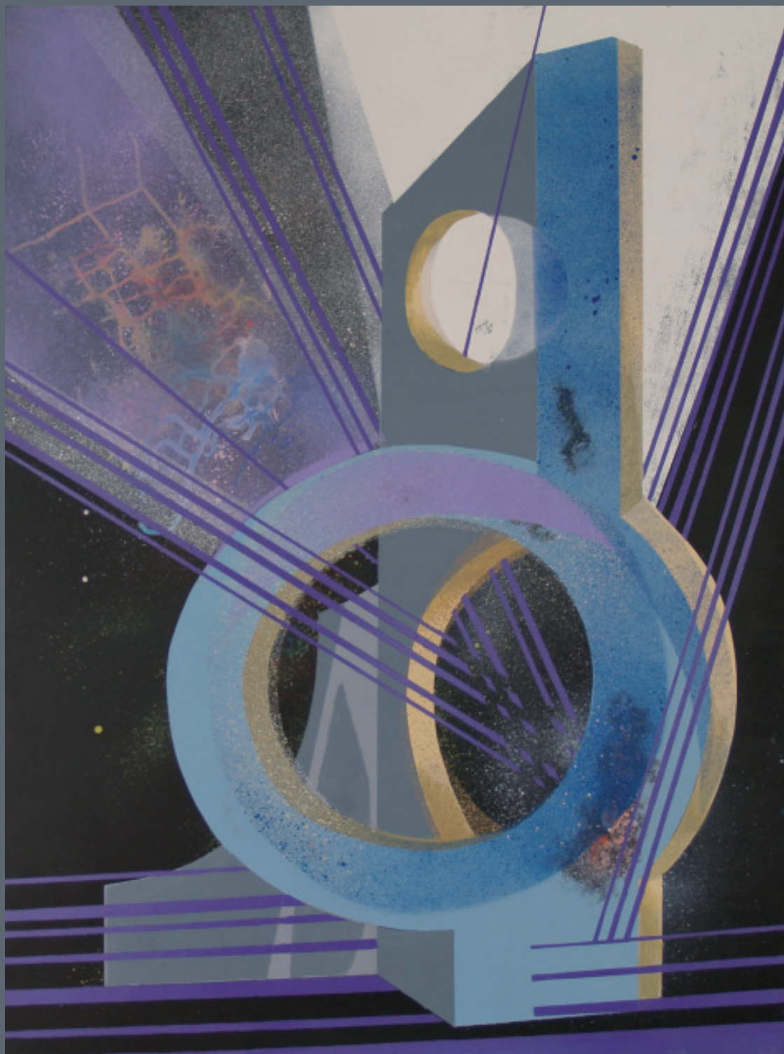
JESUS NUÑEZ. Serie Salmanticense IV. Pintura. Acrílico y óleo, 2008.