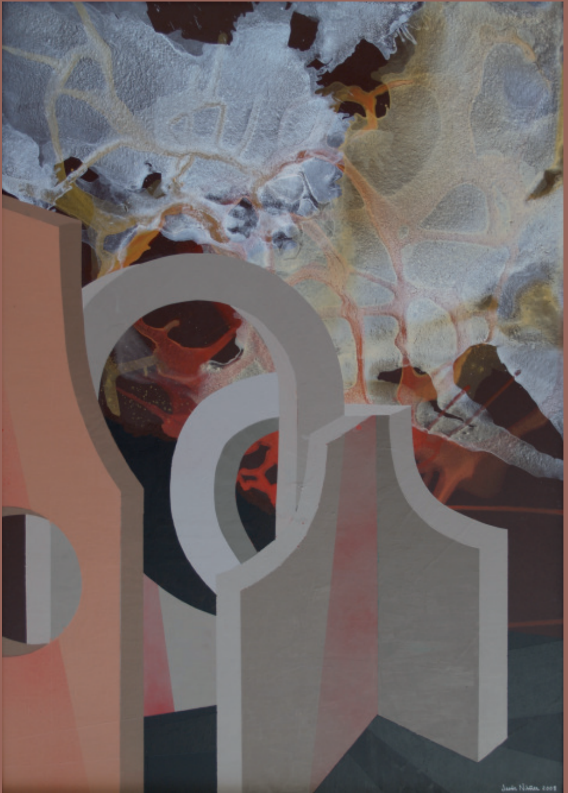
JESUS NUÑEZ. Serie Salmanticense IV. Pintura. Acrílico y óleo, 2008.