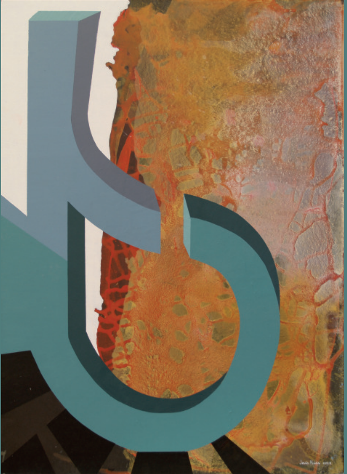
JESUS NUÑEZ. Serie Salmanticense IV. Pintura. Acrílico y óleo, 2008.