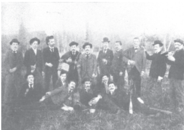
Xuntanza de betanceiros no bosque bonaerense de Palermo en 1897, precursora do Centro Betanzos