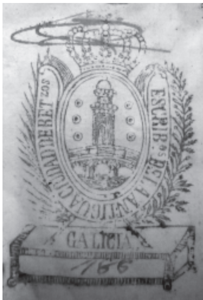
Carimbo dos «Escribanos de la Antigua Ciudad de Betanzos, Galicia» nun certificado dun expediente de 1854.