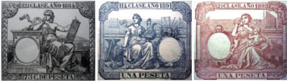
Tres gravados de papel selado de distintos anos nos que se escribían as actas de licenza.

Cando non tiñan moi claro o punto de destino, este descríbese dun xeito ambiguo: Así, nun consta que se dirixe á La Habana «u otro punto de la Isla de Cuba que crea combeniente», outro ás «Repúblicas de Montivideo y Buenos aires», «pasar a la Isla, republica de Buenos Aires, Montivideo, ó á otra que mejor le convenga», «América del Sur y República Argentina», «América del Sur», «América del Sur ó sea á la República Argentina», «República Argentina o bien para la Oriental del Uruguay», «Rep. de Buenos Aires u otra plaza». A fórmula tiña variantes.