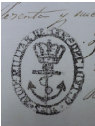
Carimbo da «Ayudantía Militar de Marina del Distrito de Sada».

Os menores de idade (a maioría de idade estaba nos 23 anos na época analizada) debían estar autorizados a marchar polo pai, titor ou nai (no caso das viúvas ou nais solteiras), quen se presentaba ante o Alcalde e asinaba a chamada «Acta de licencia». No caso das mulleres casadas esta autorización asinábaa o esposo e cando este se atopaba emigrado tiña que «reclamala» (ao igual que aos fillos cando os había) a través dunha carta que a esposa presentaba na Alcaldía co resto dos documentos. Polo mesmo, se o home casado emigraba precisaba licenza da súa esposa.