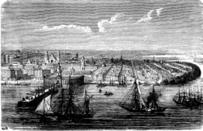
O porto de Bos Aires nun gravado de 1887.